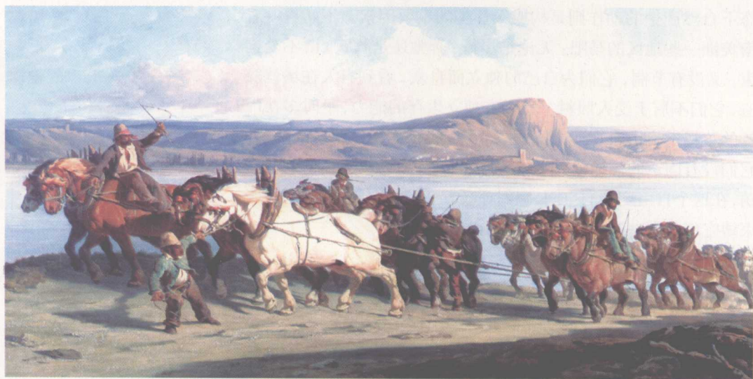
马的驯化,极大地提高了人类运输和战争能力。不仅如此,在古代西欧,人们利用马来耕种,效率是牛耕的好几倍。◆