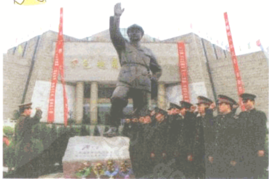
在百色起义纪念馆进行爱国主义教育的解放军某部官兵