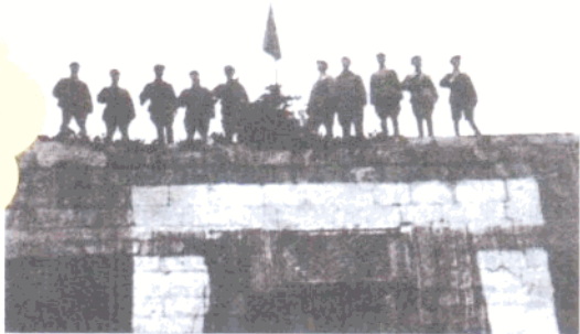
五星红旗插上镇南关