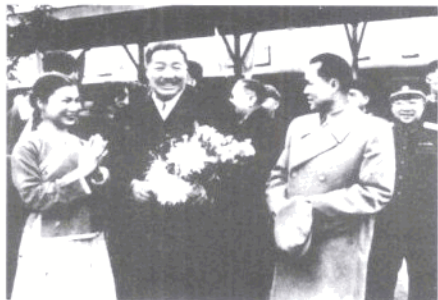
1958年，国务院副总理贺龙率中央代表团祝贺广西壮族自治区成立