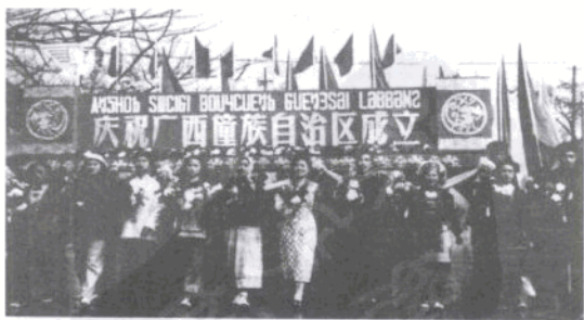
广西各族人民欢庆自治区成立

20世纪50年代至80年代，除广西壮族自治区成立外，在广西境内还先后建立过13个民族自治县、1个民族自治州。1958年成立广西壮族自治区时撤销桂西壮族自治州，1993年撤销了防城各族自治县，目前广西拥有12个民族自治县。