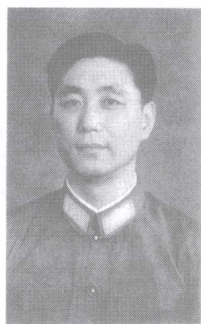
1976年10月，王洪文急切地拍了标准照。