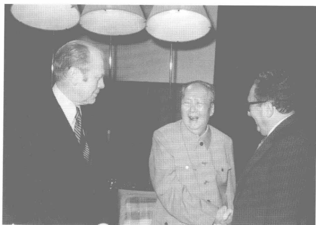
毛泽东会见新任美国总统福特