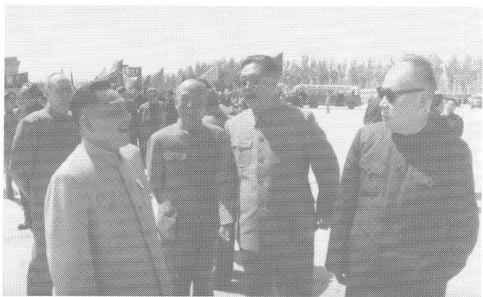
邓小平、李富春、陈毅等在首都机场