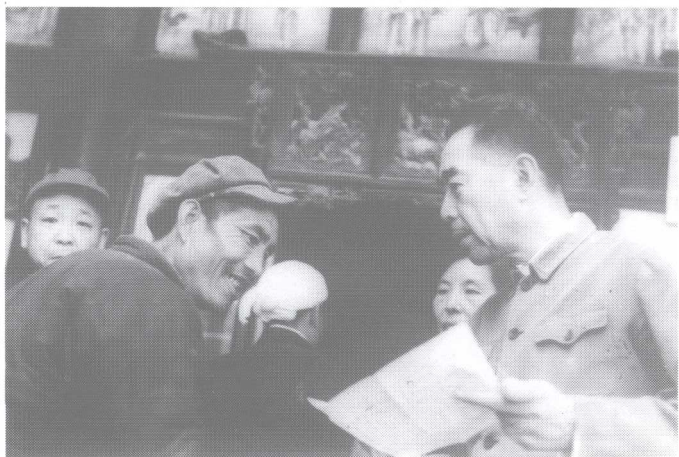
1961年是周恩来的调查年,他有一半的时间在农村