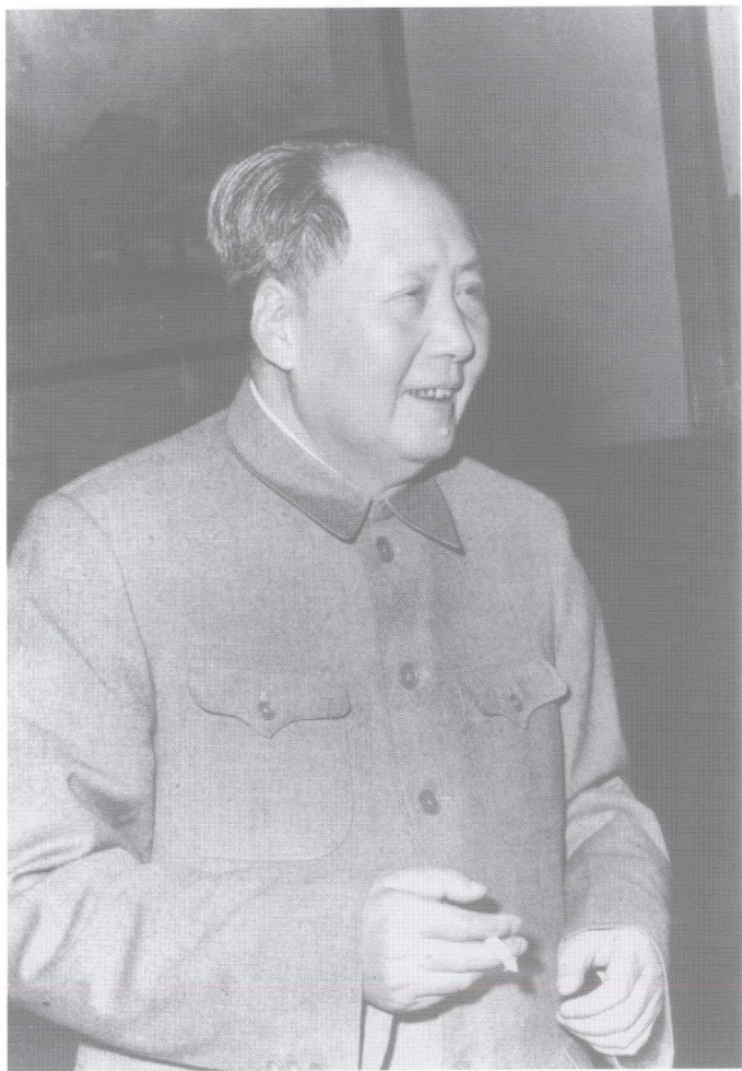
1965年1月毛泽东在北京