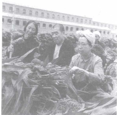
江青在大寨装模作样参加“劳动”。