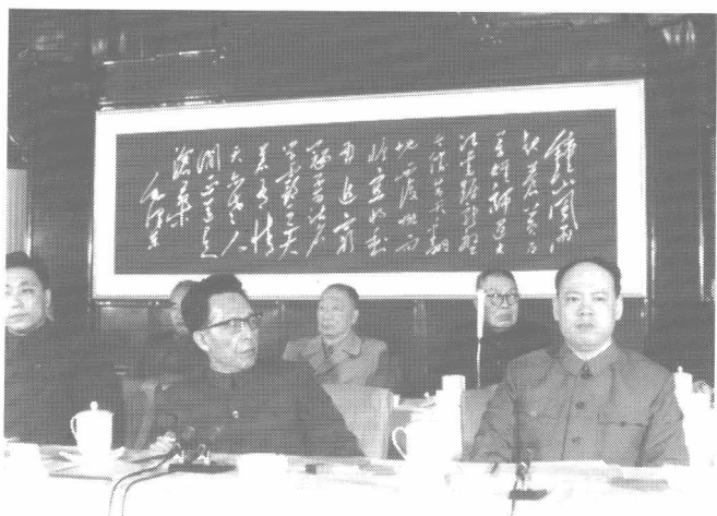
张春桥、姚文元、王洪文进入中央政治局