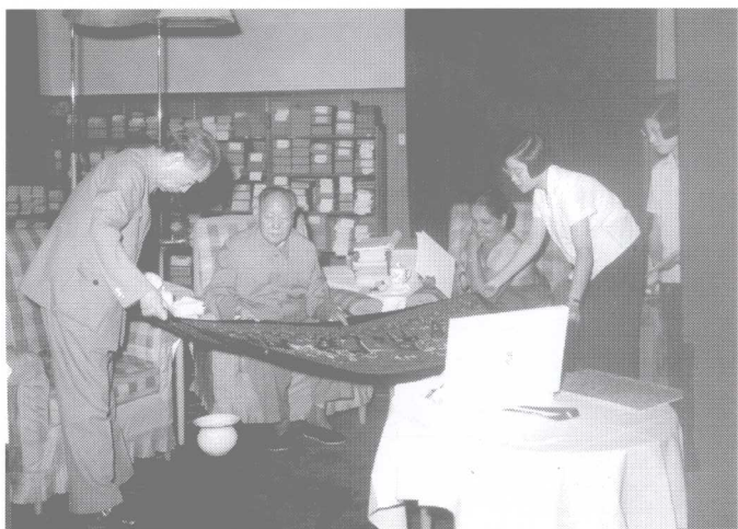
1972年6月8日,毛泽东、周恩来在中南海会见斯里兰卡共和国总理班达拉奈克夫人。