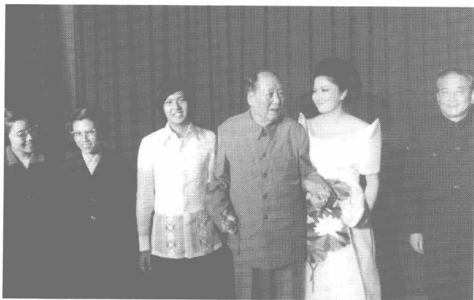
毛泽东会见马科斯总统夫人