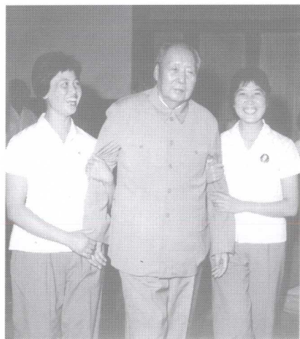
林彪叛逃后,毛泽东的身体明显不如以前了。