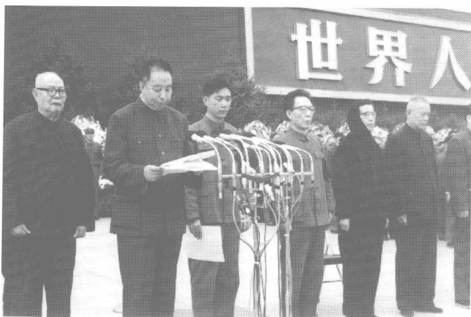
华国锋用浓重的山西口音在毛泽东主席追悼会上致悼词