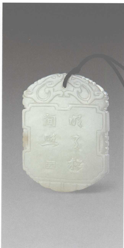
名称：山水亭阁纹牌

年 代 清 玉 质 和田白玉 重量 23g 尺 寸 长 5.1cm 宽 3.8cm 厚 0.4cm 品 级 美品