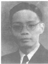
李承林 (1921~1949)重庆市人,中共党员。1948年6月被捕,1949年11月27日殉难于松林坡。