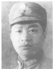
叶 挺 (1896~1946) 广东惠阳人,中共党员,新四军军长。1941年在“皖南事变”中被扣押。1946年3月4日,经中共中央大力营救获释,同年4月8日,在飞赴延安途中,因飞机失事遇难于山西兴县黑茶山。