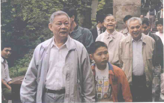
全国政协副主席叶 选平参观烈士陵园