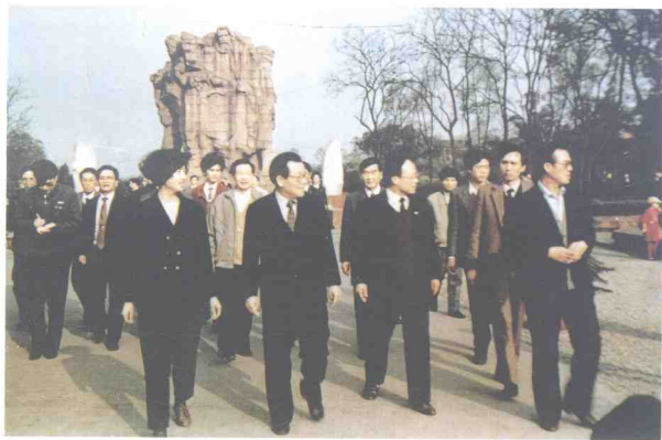
中共中央政治局常委、全国政协主席李瑞环同志来烈士墓参观