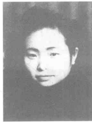
江竹筠 (1920~1949) 女,四川自贡人,中共党员。1948年6月被捕,1949年11月14日殉难于电台岚垭。