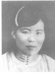
徐林侠 (1904~1949) 女,江苏邳县人,中共党员。1941年11月被捕,1949年9月6日殉难于松林坡戴笠警卫室。