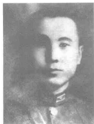
黄显声 (1896~1949) 辽宁凤城人,东北军骑兵师师长兼53军副军长。1938年3月被捕,1949年11月27日殉难于步云桥。