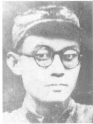
罗世文 (1904~1946) 四川威远人,中共党员,中共四川省委书记。1940年3月被捕,1946年8月18日殉难于松林坡戴笠停车场。