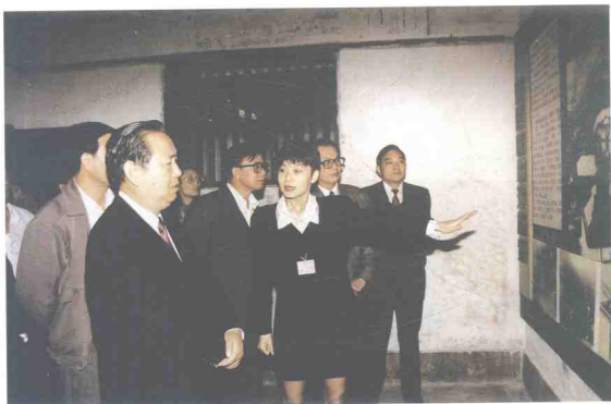
国务院副总理姜春 云参观烈士陵园