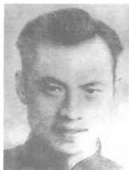
许建业 (1921~1948) 四川邻水人,中共党员,中共重庆市委委员,1948年4月被捕,同年7月21日殉难于重庆白家湾。