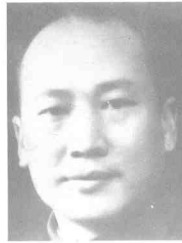
李宗耀 (1899~1949) 四川屏山县人,民革川康分会负责人。1949年5月被捕,同年11月28日殉难于西南长官公署二处防空洞。