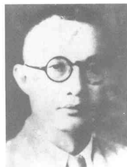
周从化 (1895~1949) 四川新都人,中共党员,民革川康分会负责人。1949年8月被捕,同年11月27日殉难于白公馆。