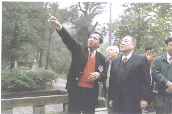
全国人大副委员长布赫同志参观烈士陵园