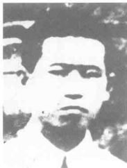
赖德国 (1921~1949) 四川云阳人,中共党员。1948年6月被捕,1949年11月27日殉难于渣滓洞。