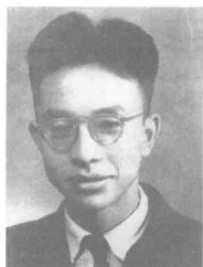
王朴 (1921~1949) 四川江北县人,中共党员,重庆北区工委委员,1948年4月被捕,1949年10月28日殉难于大坪刑场。