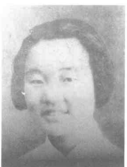
张露萍 (1921~1945) 女,四川崇庆人,中共党员,军统电台特支书记,1940年3月被捕,1945年7月殉难于贵州息烽快活岭。