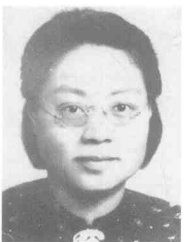
胡其芬 (1918~1949) 女,湖南长沙人,中共党员,重庆市委妇委书记,1948年4月被捕,1949年11月27日殉难于渣滓洞。