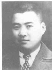
宋绮云 (1904~1949) 江苏邳县人,中共党员,西北特支委员。1941年9月被捕,1949年9月6日殉难于松林坡戴笠警卫室。