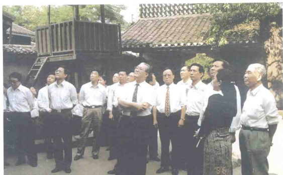
中共重庆市委书记 张德邻带领市委、人大、 政府、政协领导参观渣滓 洞监狱旧址