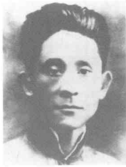
车耀先 (1894~1946) 四川大邑人,中共党员,川西特委军委委员。1940年3月被捕,1946年8月18日殉难于松林坡戴笠停车场。