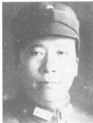
杨虎城 (1893~1949) 陕西蒲城人,国民革命军第十七路军总指挥,国民党中央监察委员,“西安事变”的发动者之一。1937年11月被捕,1949年9月6日,被秘密杀害于重庆松林坡戴笠会客室。