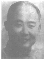
费汎 (1905~1945) 江苏吴江人,民盟盟员。1945年3月在重庆千厮门遭特务绑架,后被秘密杀害。