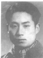
陈然 (1923~1949) 北京人,中共党员,《挺进报》特支组织委员,代理书记,1948年4月被捕,1949年10月28日牺牲于重庆大坪刑场。