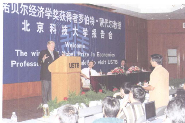
9月15日, 诺贝尔经济学奖获得者罗伯特蒙代尔教授来校讲学并受聘为北科大名誉教授