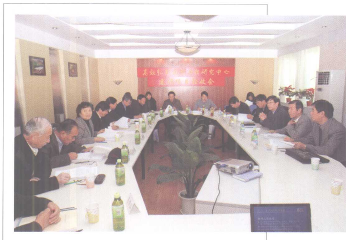
11月8日，高效轧制国家工程研究中心通过 国家发改委、教育部专家组验收