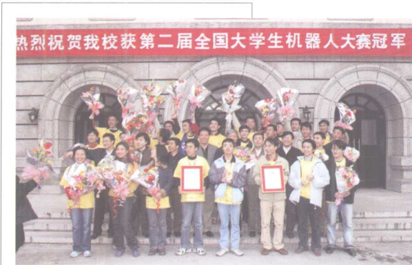
11月3日, 北科大代表队获得第二届“红河杯” 全国大学生机器人电视大赛冠军