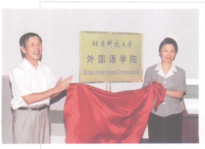
8月29日，外国语学院成立