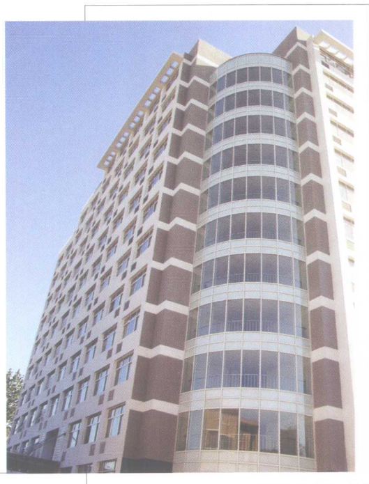
2003年底竣工的土木环境楼