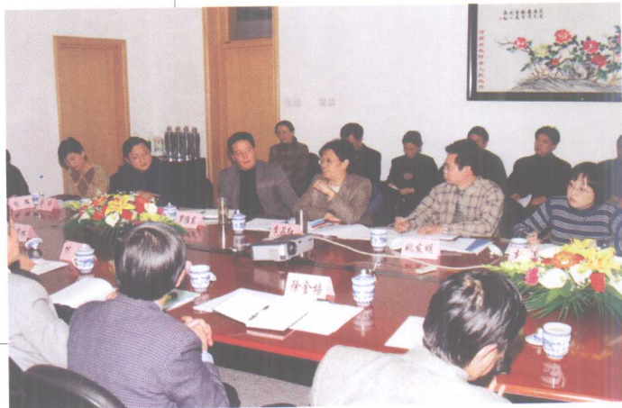
11月6日,教育部党组成员、人事司司长李卫红等到校考察