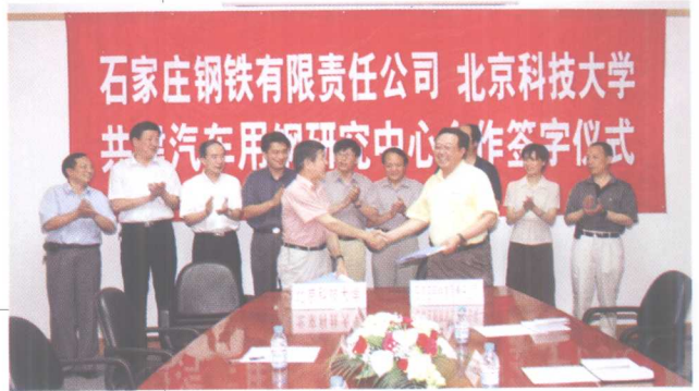
7月10日, 与石家庄钢铁公司签署 合作协议, 共建汽车用钢研究中心