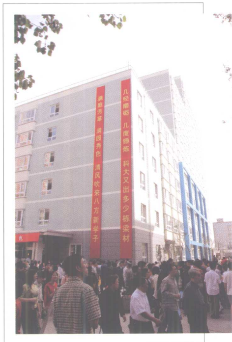
9月19日, 新学生公寓(一期)落成投入使用