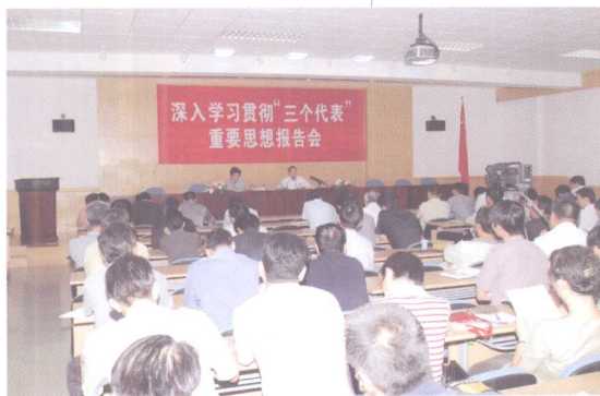
深入学习贯彻“三个代表”重要思想