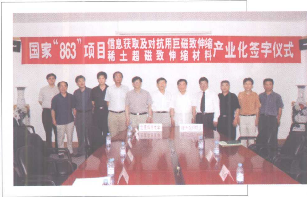
6月27日, 举行国家“863”项目“巨磁致伸缩 稀土超磁致伸缩材料”产业化合作签字仪式