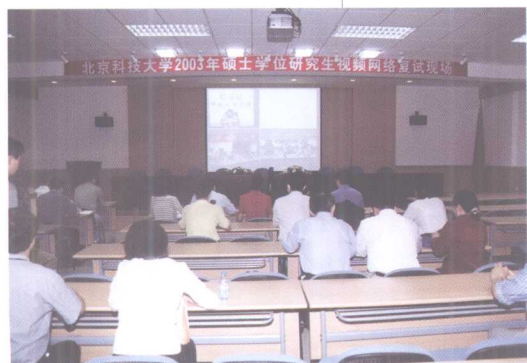
5月27-30日, 北科大采取电话、视讯、网络视频等方式进行研究生招生复试工作