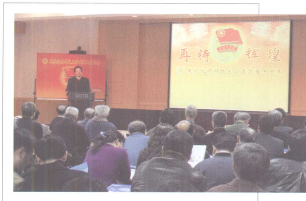
12月20日, 举行北科大共青团 成立50周年庆祝活动