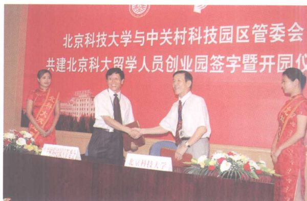
6月29日，北京科大留学人员创业园举行开园仪式， 中央政治局委员、北京市委书记刘淇同志致信祝贺