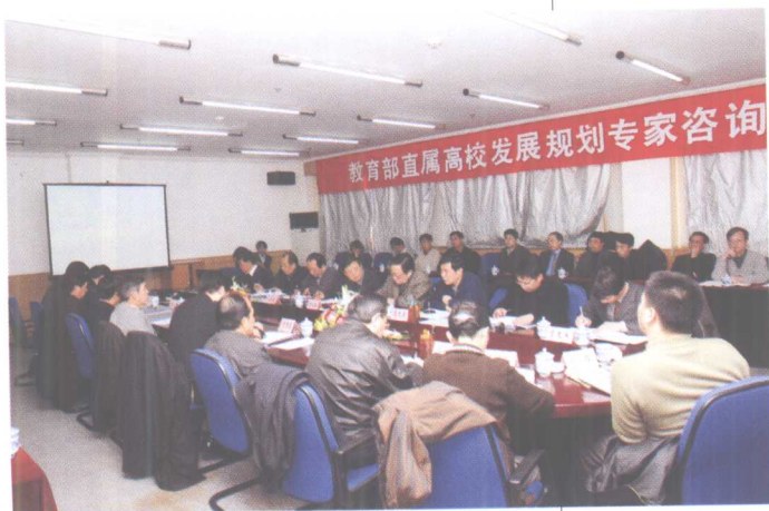
12月21-23日,教育部直属高校发展规划专家组来校考察指导工作