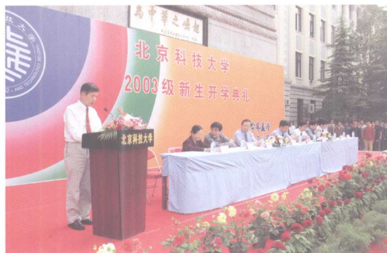
9月22日, 举行2003级新生开学典礼