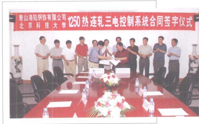
9月15日, 与唐山港陆钢铁公司签定 1250热连轧三电控制系统技术合同