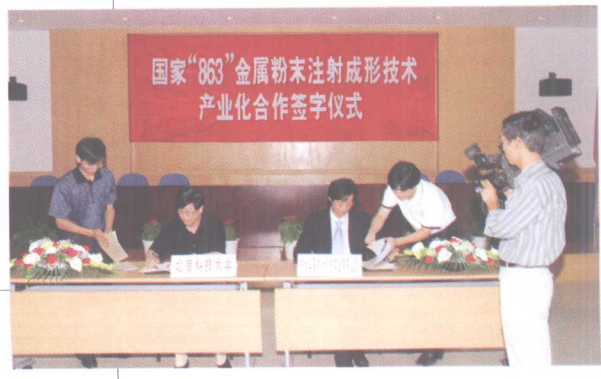
9月16日, 举行“863”项目“金属粉末 注射成形技术”产业化合作签字仪式