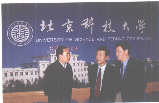
4月29日,教育部周济部长(左一)来校视察。