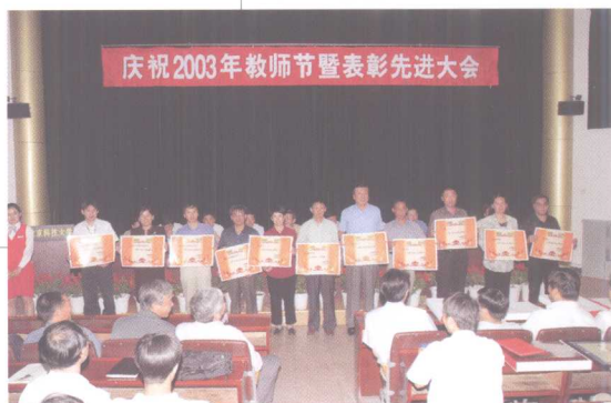
9月10日, 召开庆祝2003年教师节暨表彰先进大会