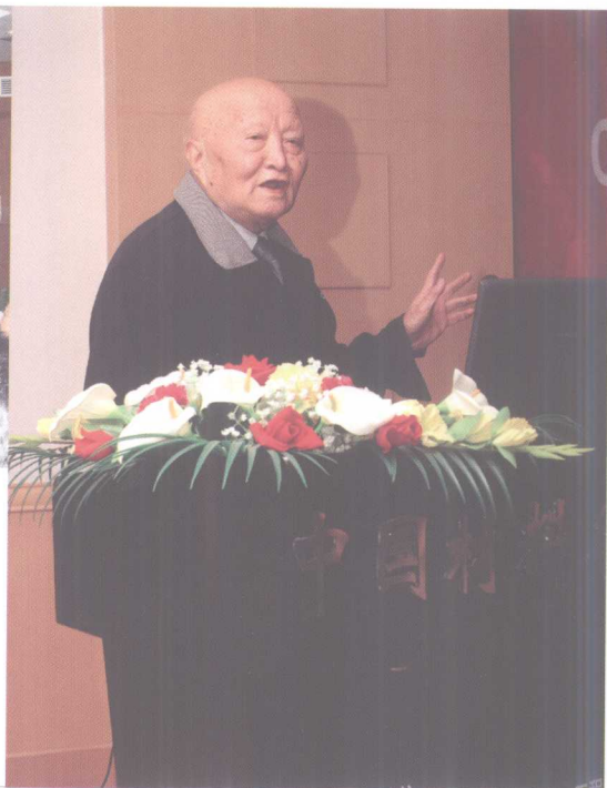
11月10日, 举行中国材料名师讲坛开讲仪式, 两院院士师昌绪作第一讲