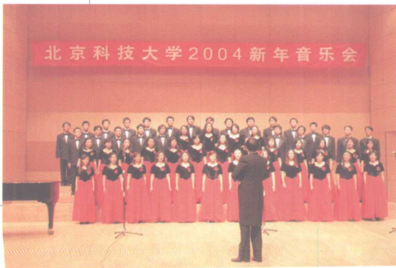
12月17日, 学生艺术团在国家图书馆 音乐厅举行2004年新年音乐会