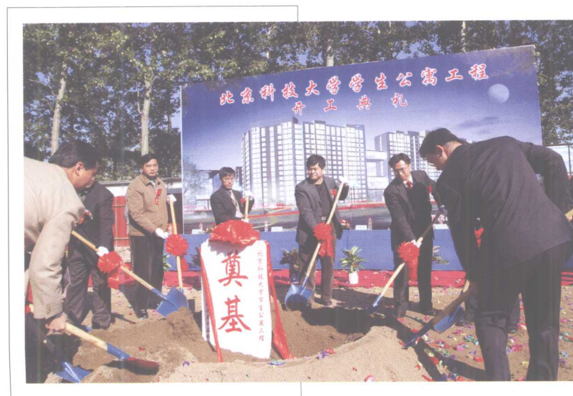
10月15日, 学生公寓(二期) 工程开工