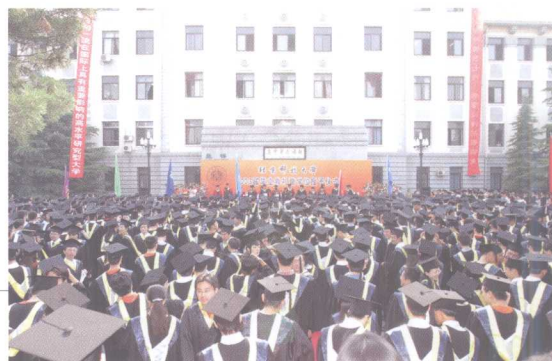
7月1日, 举行2003届本科生毕业典礼暨学位授予仪式