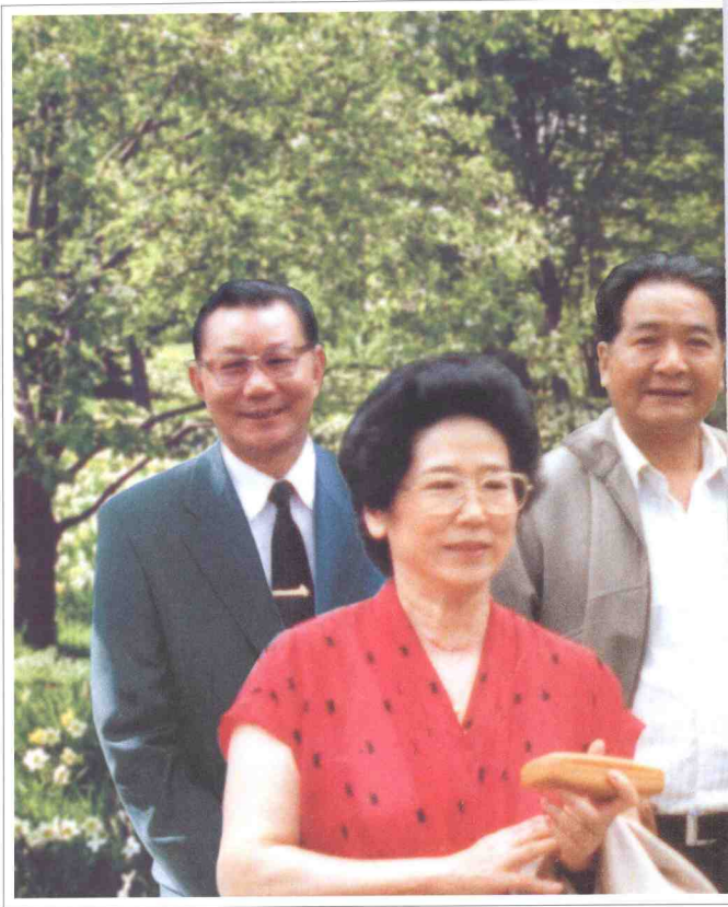
李鹏委员长在昆明金殿（中国'99昆明世界园艺博览会会址）考察。后排左一为云南省人大常委会主任尹俊，后排左二为全国政协常委（原云南省省长）和志强。