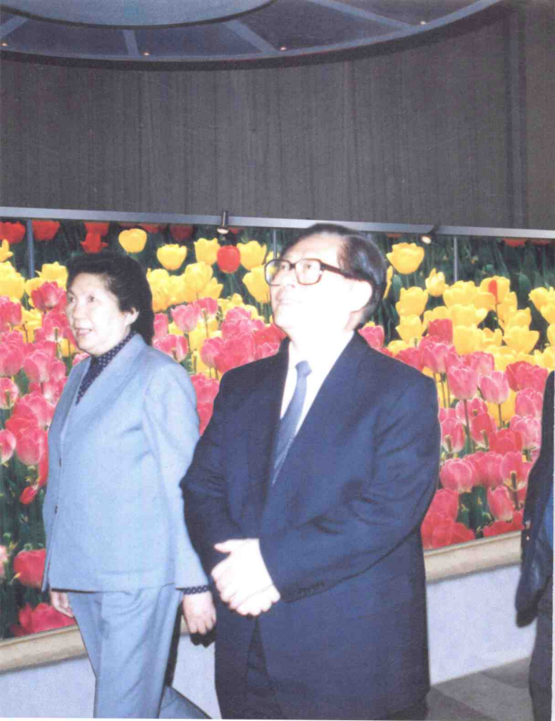
江泽民总书记在中国花卉协会名誉会长陈慕华和会长何康陪同下参观第三届中国花卉博览会。