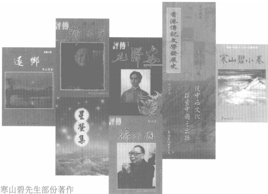
寒山碧先生部份著作