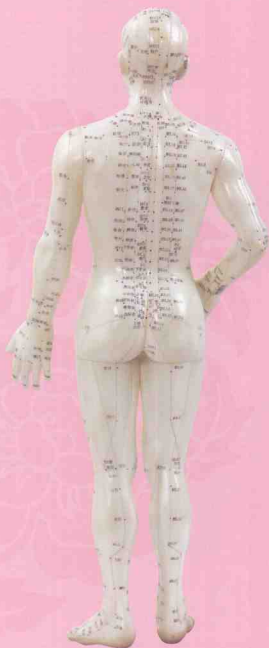
人体背面经络穴位图