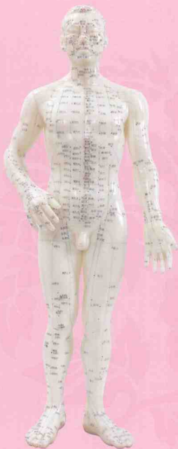
人体正面经络穴位图