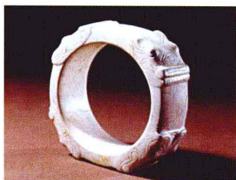
龙纹玉镯 良渚文化 浙江反山遗址

长江下游江浙沪皖地区大致可分两大块：太湖流域、宁绍平原。距今六七千年的河姆渡、马家浜文化，五千多年的崧泽文化，四千年左右的良渚文化，始终以最先进最发达的状态崛起在东南沿海一带，而这些文化的玉器工艺同样散发出灿烂的光彩。