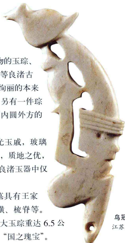
鸟冠玉人 良渚文化 江苏昆山赵陵山遗址

江苏南京市北阴阳营遗址有璜、管、玦、环、坠、泡等。浦口区营盘山遗址的一种外缘锯齿形花边玉璜与长江中游的大溪文化风格接近。