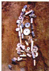
江苏寺墩良渚墓现场 几十件玉璧、琮等环绕墓主一圈，被认定为文献所说的“玉敛葬”。

距今四千多年的良渚文化玉器是中国新石器时代晚期琢玉工艺最高水平的代表之一。形制复杂，有琮、璧、戚、钺、管、镯、珮、璜、珠、环、琮、项链、带钩、梳脊、柄形器、锥形器、柱形器、山字形器以及鱼、鸟、龟、蝉、猪等动物造型，方柱体的玉琮最高近 50 厘米。一些玉器上纤若发丝、密过蛛网的阴线刻画，镂雕隐起、光若镜面的琢磨抛光技术，在至今未曾发现同期金属工具的情况下，简直不可思议。