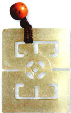
工字牌 清代 私人收藏 此器造型若扁化的两节玉琮，功能当与地有关。

潇洒的定律，那就是在琢玉题材方面从来就没有负面的内容，都是吉祥、美好、趋吉、辟邪的图样。这是很多人，包括不