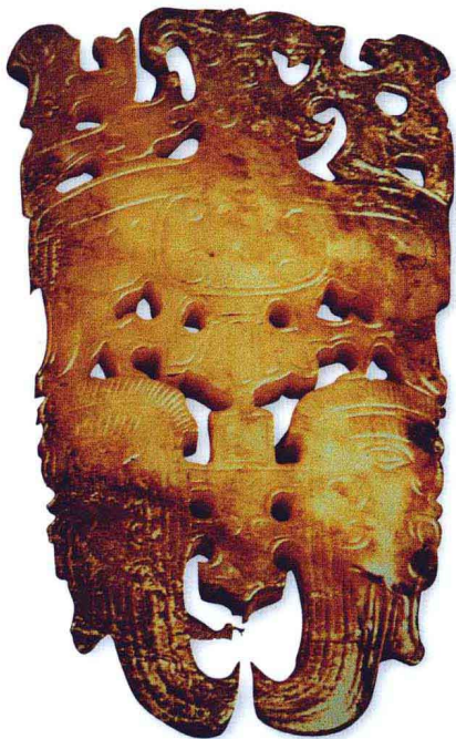
鹰攫人首纹玉珮 龙山文化 北京故宫博物院

本书就初涉藏玉者可能碰到的一些基本知识及密切相关问题，展开具体的解析，以供参考。