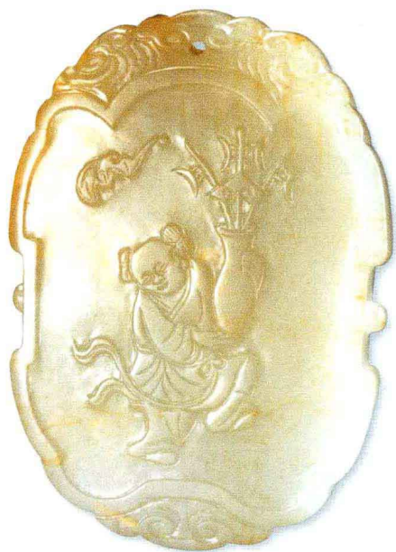
平升三级 清代 上海文物商店

关于这一类故事，在我国的古代文献上，在存世的古玉中繁若星辰，数不胜数。当今的玉器研究又因衍生出来的分支越复