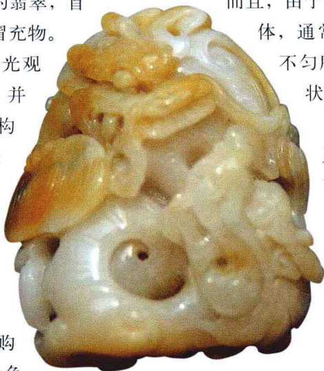
双龙嬉戏翡翠挂件 现代 私人收藏

显然，初涉收藏者，只要摆正心态，地摊也可以是一个不错的演练眼力，上手实践的好去处。