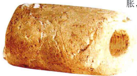
管形玉琀 马家浜文化 上海崧泽遗址 此玉琀舍于死者口中，非工具，非装饰用，是中国最早的意识形态用玉。

石器时代晚期，由于意识形态上的需要，玉之神秘性骤然膨胀，质量高，品种多，数量大的法器、礼器，包括含有辟邪等神秘功能的装饰品大量出现。红山文化、良渚文化、石家河文化等各个区域性特征强烈的玉器异彩纷呈，形成了中国历史上的第一个用玉高峰，不过，所用的玉材基本上是就地取材的地方玉，呈现了区域不同的特色。