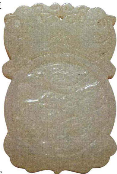
龙纹玻璃珮 现代 私人收藏

东北地区的考古工作者日晒雨林、顶风冒雪奋斗在荒山野地半个多世纪，红山文化的“C”字玉龙一共才出土了两件。马路边地摊上几乎每摊有龙，大大小小、沁色斑斑，好不热闹。前几年有专家已将红山玉龙估价至五六百万人民币，那么多的红山龙出现在地摊上，卖你