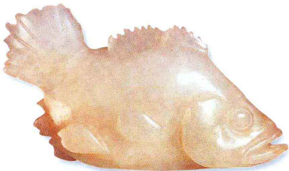
玉鱼 元代 上海松江西林塔