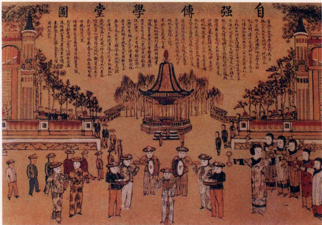
自强传学堂图 20世纪初

个正直古板，一个趋奉有术，没有多久，嘉靖皇帝遂找了个名目杀了夏言，并以严嵩补位。严嵩尽管机诈，但却真正掌握住了服装的认同机制。