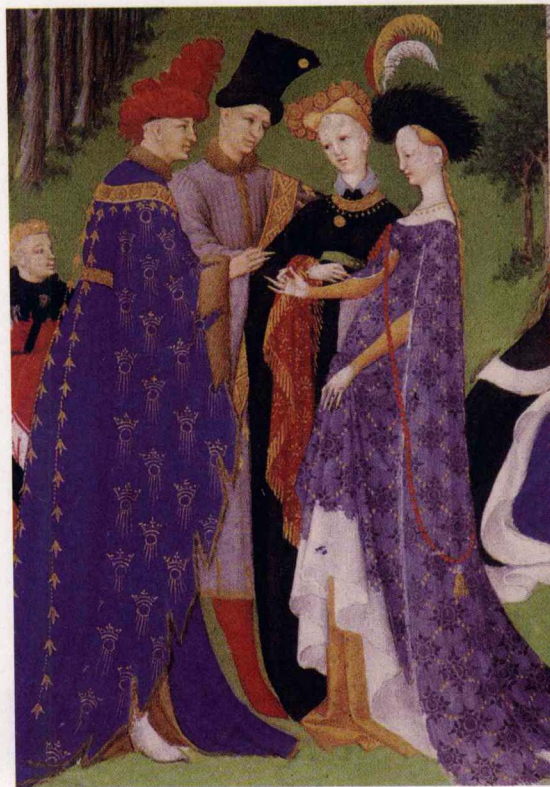
白里公爵的宝贵时光

“在上海生活，穿时髦衣服的比土气的便宜（指的是方便）。如果一身旧衣服，公共电车的车掌会不照你的话停车，公园看守会格外认真地检查入门券。大宅子或大客寓的门丁会不许你走正门。所以，有些人宁可居斗室，喂臭虫，一条洋服裤子却每晚必须压在枕头下，使两面裤腿上的折痕天天有棱角。”鲁迅讽刺上海人崇拜洋服，精准地点出了服装在权力关系里的位置，甚至可以说，围绕着服装的修辞本身即是一种权力。权力带来模仿，弱的向强的模仿，庶民向王室贵族模仿，第三