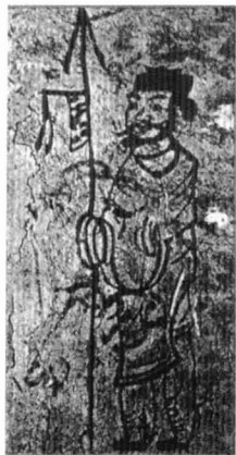
门神（汉） 辽宁旅顺出土