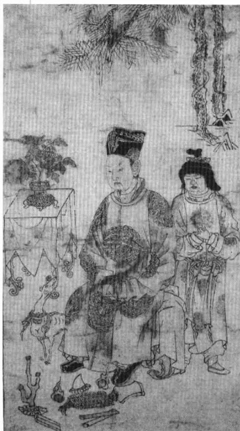
四美图真本 (金元) 山西 临汾