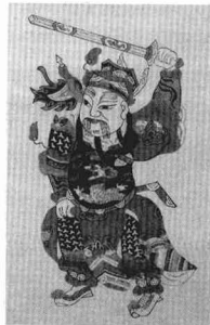
尉迟公秦叔宝 苏州 桃花坞