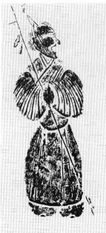
门吏 (汉) 河南

东汉，佛教传入中原后，佛寺中的守护神如金刚力士吸收了现实生活中的武士形象，神荼、郁垒逐渐成为将军扮相的门神。洛阳出土的北魏时期宁懋石室，室门两旁有线刻的金甲武士，面部表情勇猛有力，身躯粗壮，全身披挂的装束及饱满的构图开始带有后代门神的特点。安徽省博物馆藏有一唐