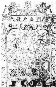
门丞户尉 (明) 北京