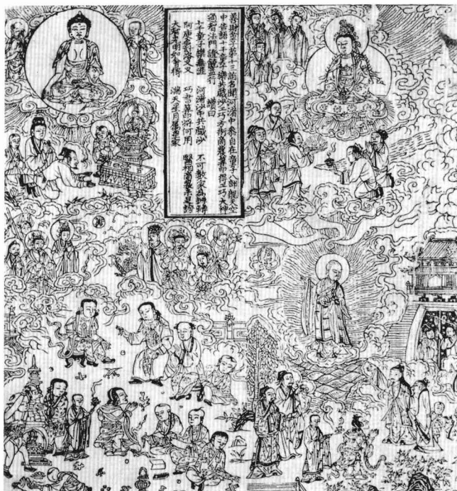
观音菩萨普门品 经之一（明） 北京