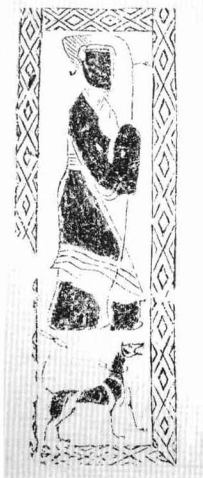
门吏 (汉) 河南