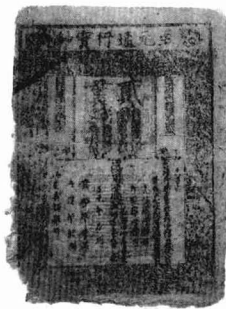
至元通行宝钞 (元) 纸币

民间还有画鸡于户的习俗，晋代王嘉在《拾遗记》中说：“有祗支之国献重明之鸟，一名重睛，双睛在目，状如鸡，鸣似凤，时解羽毛肉翻而飞，能逐搏猛兽虎狼，使妖灾群鬼不能为害。饴以琼膏，或一岁数来，或数岁不至。周人或刻木或铸金为此鸟之状，置于门户之间，则魍魅丑类自然退伏。今人每岁元日或刻木铸金，或图画鸡于牖上，盖重睛之遗像也。”