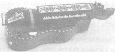
Eine alte Drehleier, wie sie früher für Tanzmusik verwendet wurde.

Clara Schumann (1819–1896), dt. Pianistin u. Komponistin