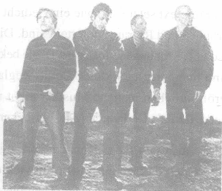
Die deutsche Hip-hop-Band „Die Fantastischen Vier“