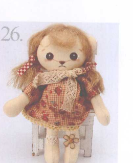
26. Strawberry 做法 ✨ P.88