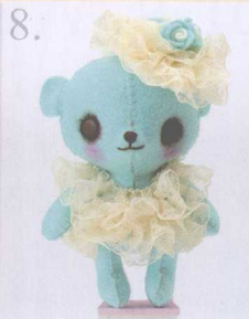
8. Lady Bear 做法 ✨ P.89