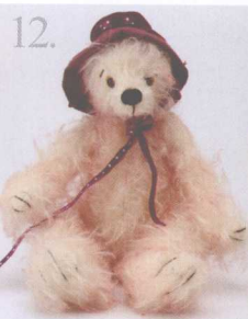
12. Spring 做法 ✨ P.58