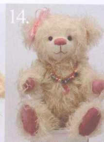
14. Anges 做法 ✨ P.66