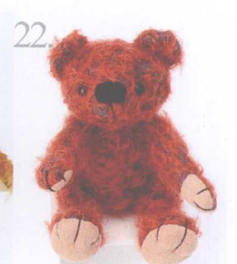
22. Mr. Nice 做法 ✨ P.59