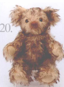
20. Innocence 做法 ✨ P.80