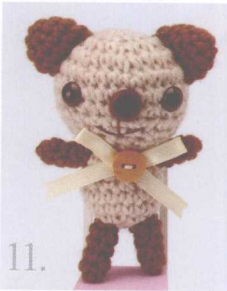
11. Gift Bear 做法 ✨ P.90