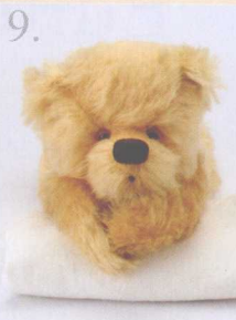
9. Comfort 做法 ✨ P.69