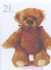
21. Little Joice 做法 ✨ P.72