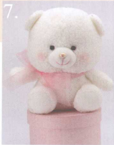
7. Bling Bling 做法 ✨ P.85