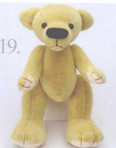
19. Rum 做法 ✨ P.65