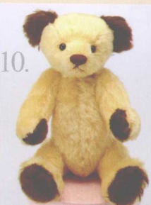
10. Pudding 做法 ✨ P.62