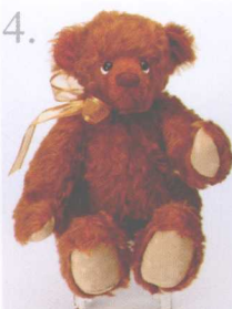
Mocha 做法 ❖ P.54