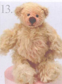
13. Ingress 做法 ✨ P.67