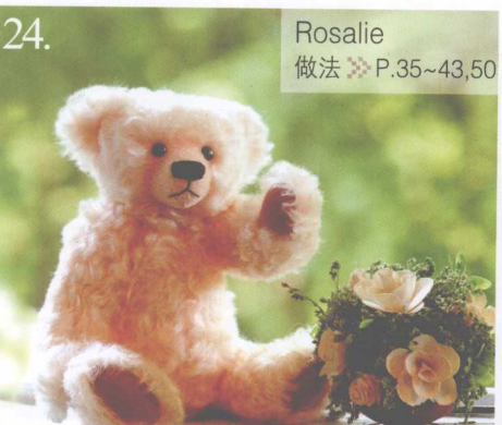
24. Rosalie 做法 ✨ P.35~43,50