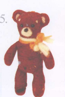
25. Little Star 做法 ✨ P.44