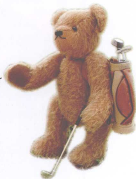
3. Charles 做法 ❖ P.73