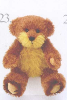
23. William 做法 ✨ P.68