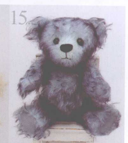
15. Violet 做法 ✨ P.64