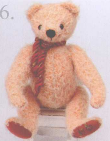
Terry 做法 ❖ P.76