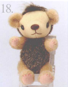
18. Hedgehog Bear 做法 ✨ P.78