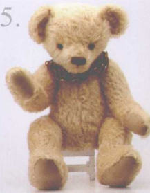
Fassett 做法 ❖ P.49