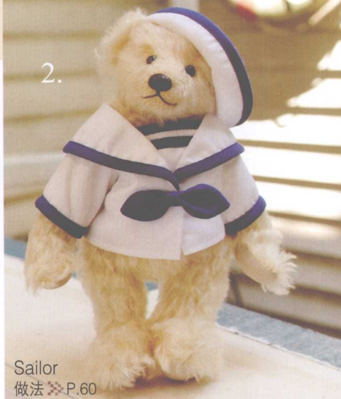
Sailor 做法 ❖ P.60