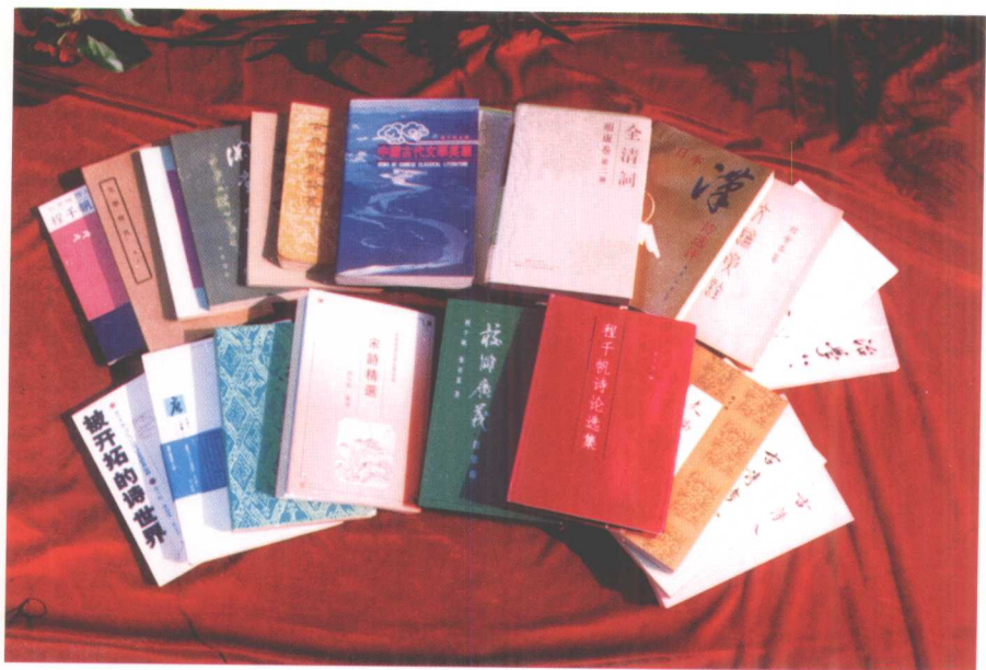
程千帆先生著作书影