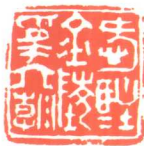
爱驻金陵为六朝 （墨庵刻）