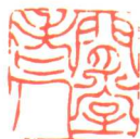
闲堂老人（黄白丁刻）