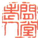
闲堂老人（魏之桢刻）