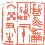
晋永嘉后二十六癸丑生 （侯疑始刻）