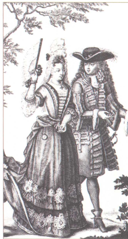
贵妇人和王室男子散步（十七世纪）。尼古拉·阿尔诺版画作品。巴黎法国国立图书馆藏品