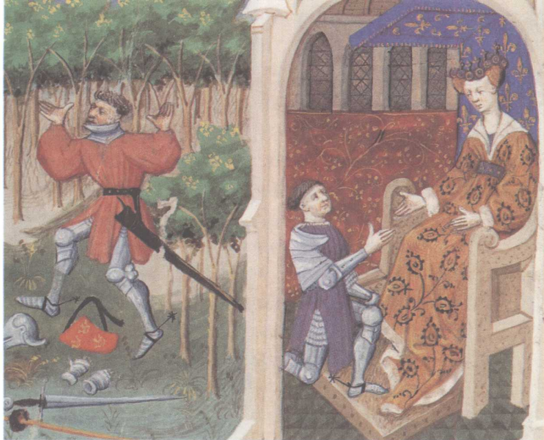
骑士小说，加拉德·特里斯当和朗瑟罗。幸亏特里斯当装疯，最终才得以在科努阿耶找到了伊瑟。香提伊孔俗博物馆藏品