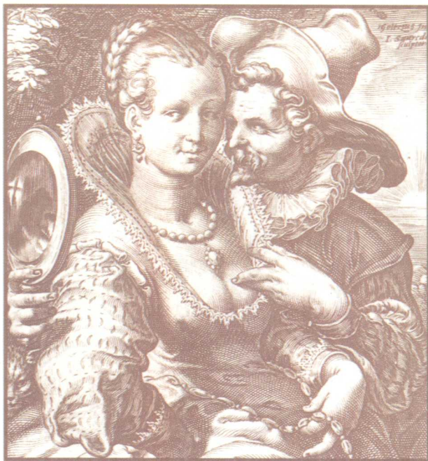
十六世纪的情侣。葛修斯画作镌版复制品。充满欲念的眼神和大胆的手势。意味深长的眼神……巴黎法国国立图书馆藏品