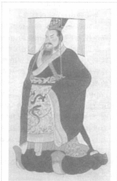
中国第一位皇帝秦始皇

公元前 238 年，嬴政车裂长信侯嫪毐，诛其三族，幽禁母亲赵太后，并杀死了赵太后与嫪毐所生的两个私生子。同年 10 月，嬴政罢黜吕不韦相国职位，将其轰出咸阳。不久，又逼吕不韦服毒自尽，并严惩了他的家人和门客，巩固了自己的君主之位。从此，年轻的嬴