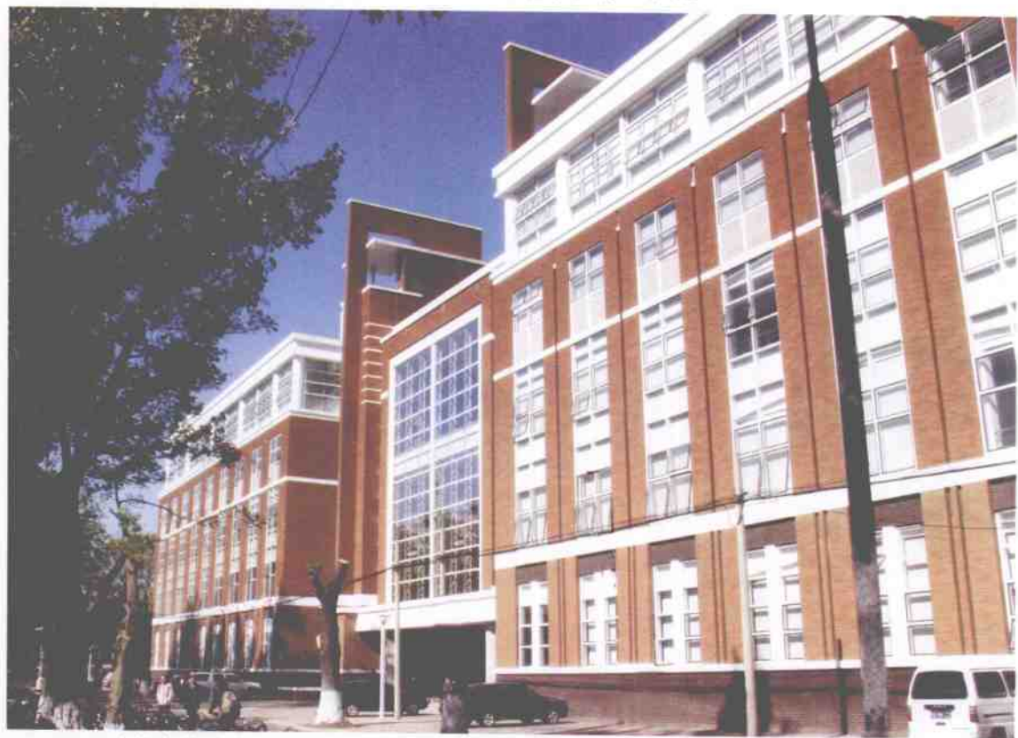
6. 我校在基础建设中实行严格管理, 狠抓质量, 保证了教学科研的顺利发展。图为2003年刚刚落成的第24教学楼。