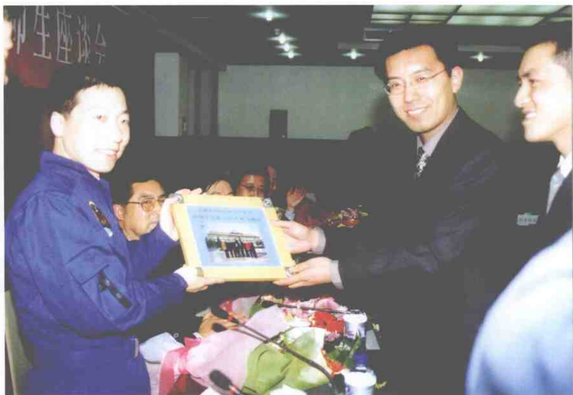
3. 2003年10月,我校研制的“中国第一代太空人赋形座垫”随着神舟五号进行了它的第一次太空旅行,为我国首次载人飞船航天的圆满成功作出了贡献。