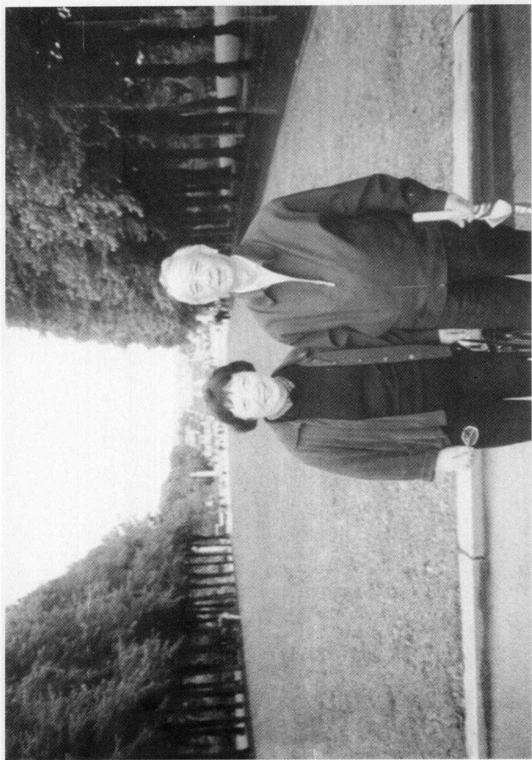
汤一介、乐黛云合影