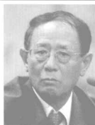
胡德平 ：1942年11月生，湖南浏阳人，胡耀邦之子。1966年5月加入中国共产党。大学学历。1962年至1967年在北京大学历史系学习。1968年在四六二七部队农场劳动锻炼。1971年为北京第二通用机械厂工人。

1972年任中国历史博物馆保管部保管员，国家文物局党委委员。1975年任中国历史博物馆保管部副主任，馆负责人。1984年任中央整党指导工作委员会湖北巡视组巡视员，华北联络组副组长，西北联络组组长。1986年任中央统战部秘书长、五局局长。1993年任全国工商联联合会副主席、党组书记。1998年任中央统战部副部长。2003年4月任中央统战部副部长、全国工商联联合会副主席、党组书记（正部长级）。第十届全国人大常委会委员、全国人大常委会司法委员会委员。