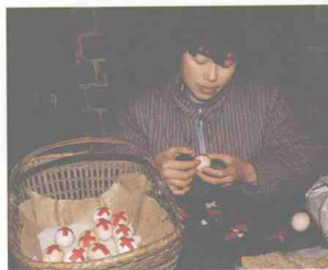
十、桃江县农家女子为孩子做生日在贴蛋花。