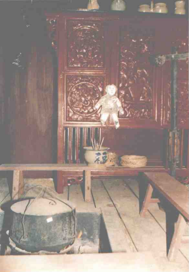
七、剪纸菩萨贴在火塘壁板上，是土家族妇女护佑儿童平安的一种风俗。