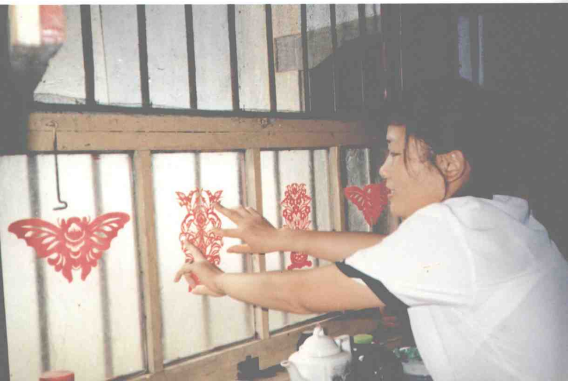
八、望城县农家妇女喜爱贴窗花美化自己的居室。