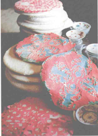
九、桃江县农村村民在寿礼糯米粑上贴满大红礼花。