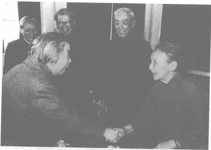
1980年4月，邓颖超与冰心亲切握手。