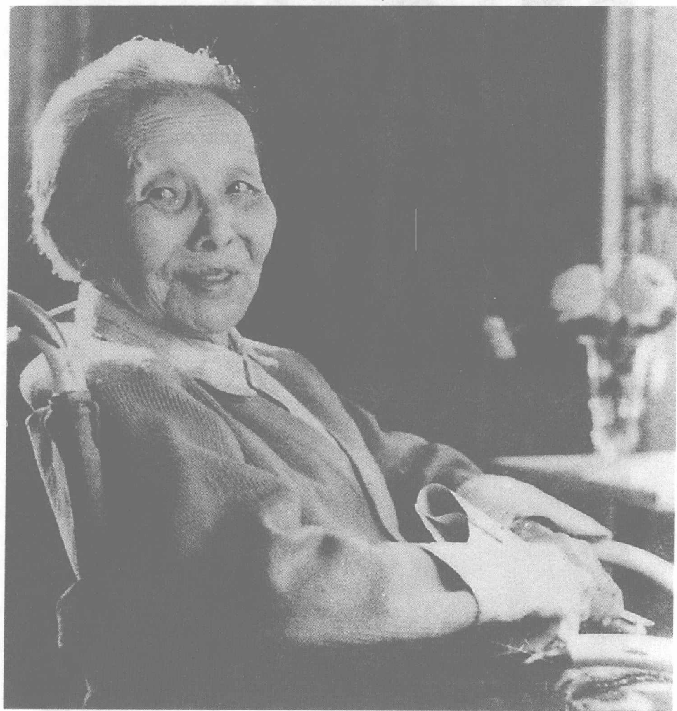
1980年12月，冰心摄于北京医院。

冰心逝世，时隔一年余，冰心纪念馆在福州建立，冰心纪念馆在福州 晋安区梅村路，冰心纪念馆在福州晋安区梅村路，冰心纪念馆在福州晋安区梅村路