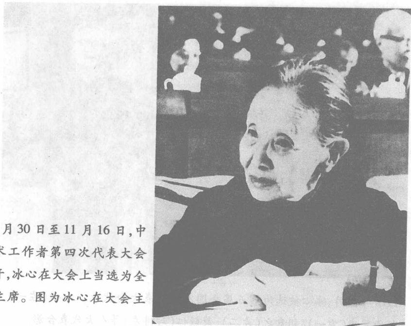
1979年10月30日至11月16日，中国文学艺术工作者第四次代表大会在北京召开，冰心在大会上当选为全国文联副主席。图为冰心在大会主席台上。