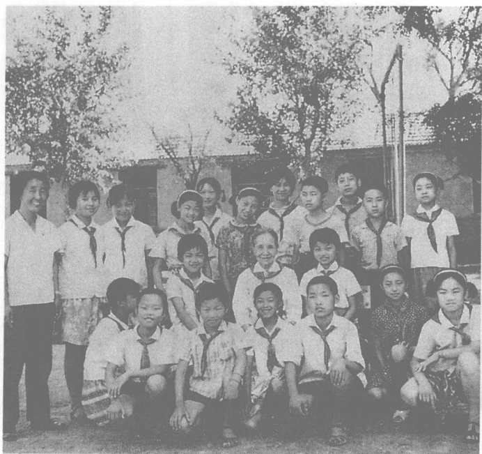
1979年6月1日，冰心与少先队员一同庆祝“六一”儿童节。