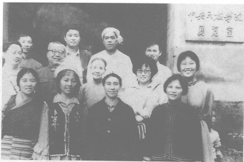
冰心与中央民族学院的少数民族学生合影。