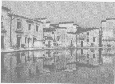
图1-1 安徽省黟县宏村

我国历史文化名镇（名村）保护从20世纪80年代末开始，先是陆续将一批村落中的古建筑群列为全国重点文物保护单位；2000年又将皖南古村落西递、宏村（图1-1、图1-2）成功申报为世界文化遗产；2002年在新修订的《中华人民共和国文物保护法》 [6] 中则明确提出要对“保存文物特别丰富并且具有重大历史价值或者革命纪念意义的城镇、街道、村庄”进行保护，2003年建设部和国家文物局 [7] 联合公布了第一批22个中国历史文