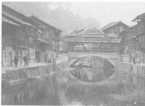
图 1-3 贵州省黎平县肇兴侗寨村

乡村文化遗产与城市文化遗产的破坏程度相比相对较弱，一些古老的村镇由于受现代经济侵袭较少而得以完整地保存下来，富有地域和民族特色的乡土建筑（图 1-3），以及浓郁民俗风情，仍都真实地记载着丰富的历史信息。但是我们也看到在当前经济社会和城镇化快速