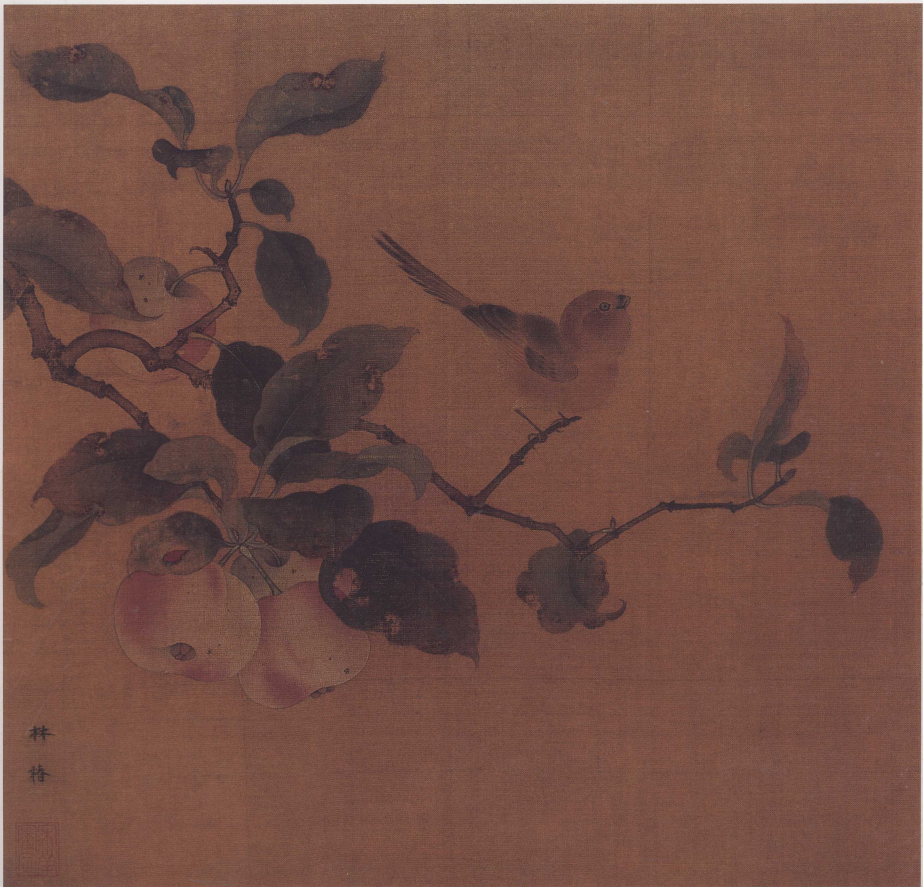
南宋 林椿 果熟来禽图页