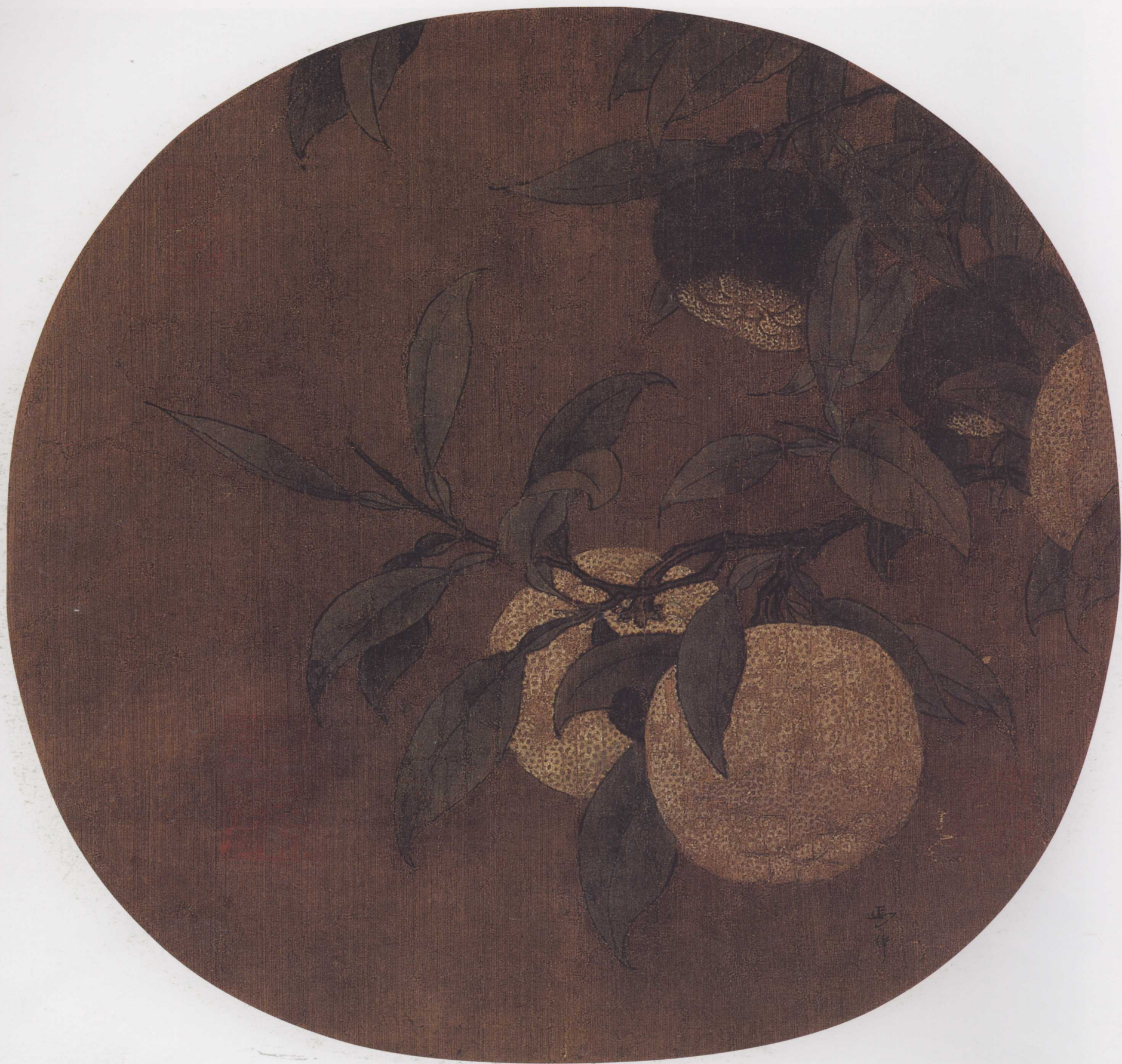
南宋 马麟 橘绿图页