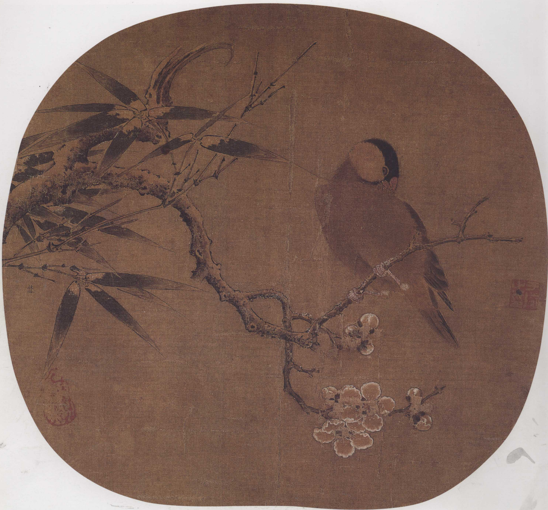
南宋 林椿 梅竹寒禽图页