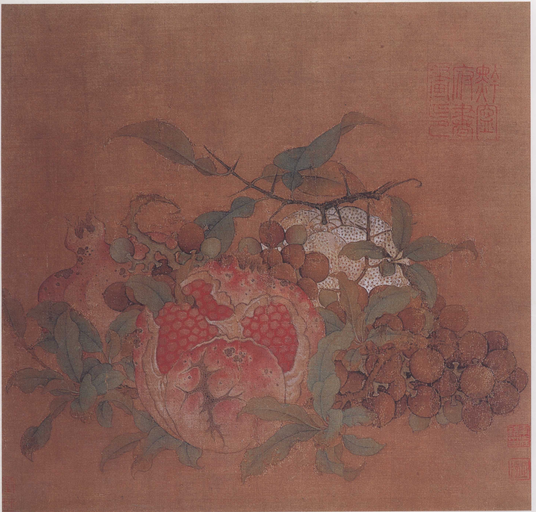
宋 鲁宗贵 吉祥多子图