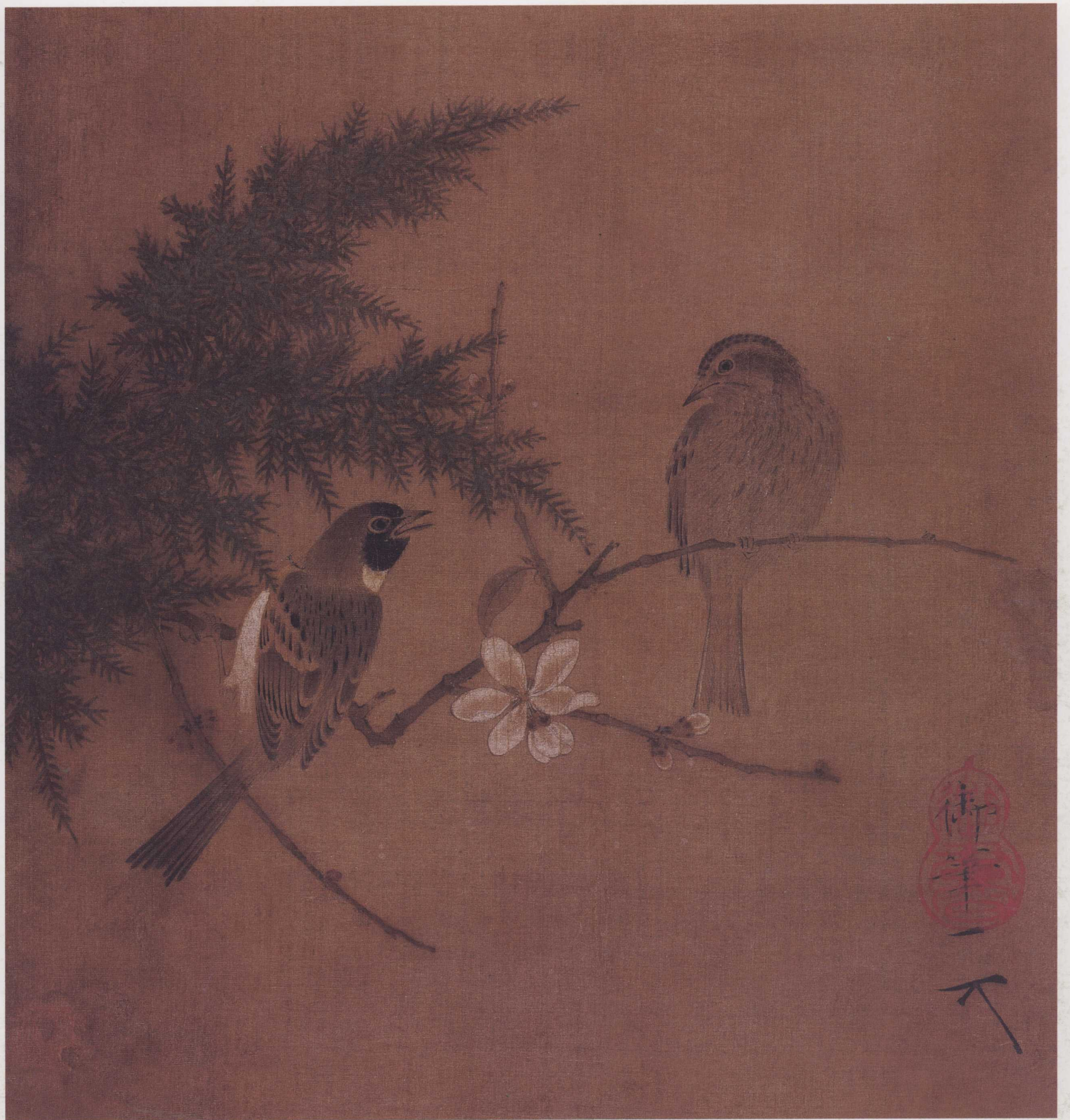
北宋 赵佶 蜡梅双禽图页