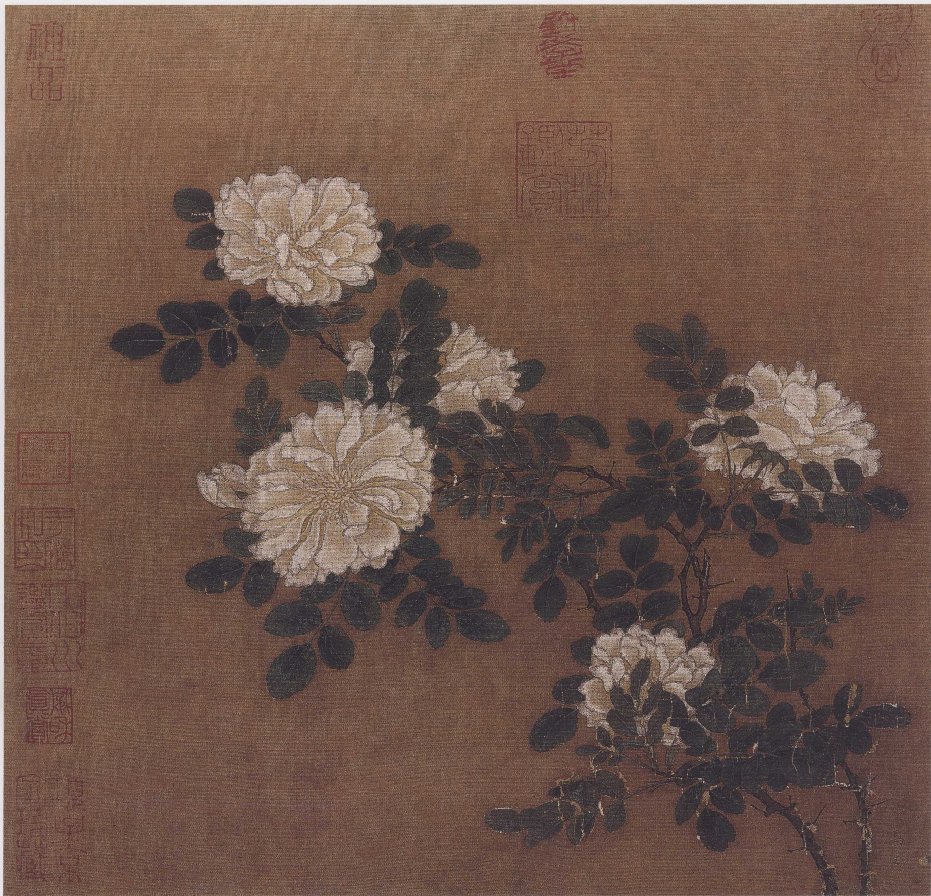
南宋 马远 白蔷薇图页