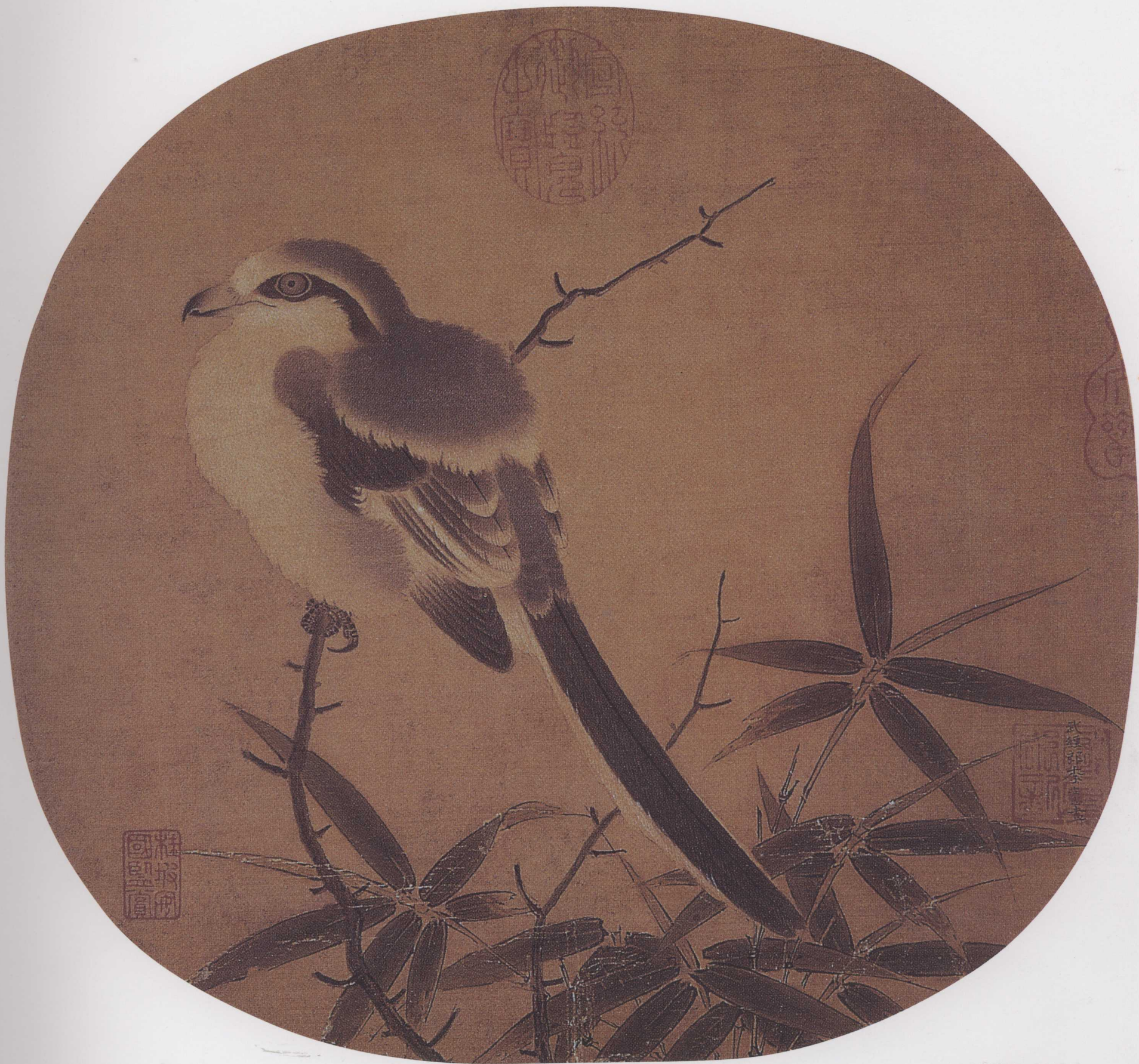
南宋 李安忠 竹鳩图页