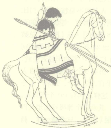
图3 拥有马匹在古希腊无疑是显贵阶层

(希腊原文是土地所产的湿的和干的，也即橄榄油和麦子)的人列为第一级，叫做五百斗级；第二级是能够养马一匹或每年收入达三百斗的人，叫做骑士级[图2]，第三级是每年收入达二百斗的，为牛轭级；第四等级为日佣级，公民按等级享受担任政府官职之权和承担军事义务。第一、二级公民充当骑兵并自备战马，第三等级充当重装步兵，第四等级则