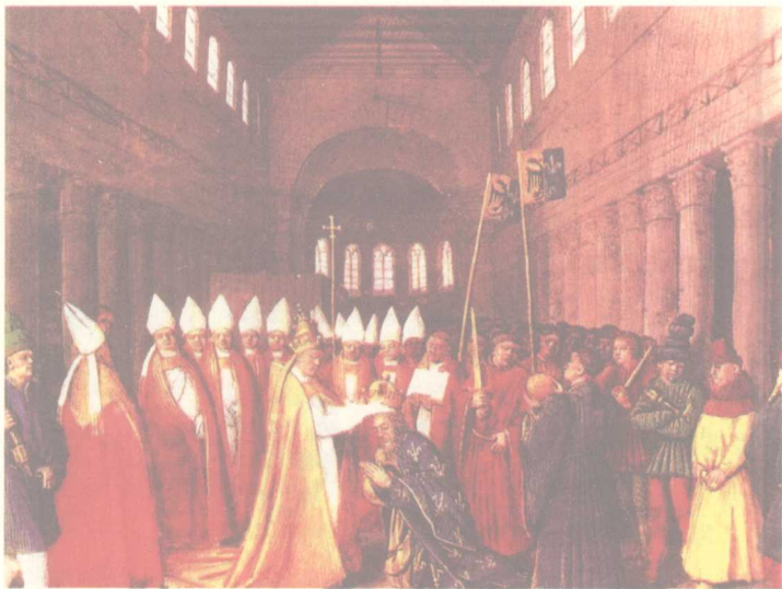
图10 公元800年查理曼被教皇利奥三世加冕为皇帝的时候，他被教皇尊称为“罗马人的皇帝”

当公元800年查理曼被教皇利奥三世加冕为皇帝的时候，他被教皇尊称为“罗马人的皇帝”[图10]，不仅仅是罗马人，似乎包括查理曼本人在内的法兰克人都十分希望重建那个早已被他们毁灭掉几个世纪的罗马帝国，由此可以看出罗马文明对于西欧封建制度形成的作用产生了多么巨大的影响。