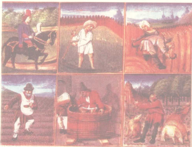
图7 封建采邑里劳作的附庸农奴和悠闲放鹰的骑士领主