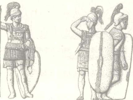
图6 根据不同财富程度，罗马男性公民被划分为五等级入伍，骑士拥有高等级地位

公元前3世纪后半叶，骑士开始由军队变成一个新的等级。骑士不再在骑兵中服役，而变成了供给步兵和骑兵的高级军官〔图7〕。与此同时，骑士有了财产资格的限制，即一百万阿司或四十万塞斯退司。公元前218年，罗马颁布了克劳狄乌斯法，禁止元老经商，把元老作为专事土地经营的特殊阶层。骑士逐渐接管了商业、包税和一般财政事务，成了罗马的金融贵族。