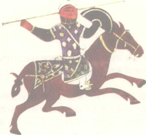
图 11 伊斯兰扩张时期的阿拉伯骑兵，曾将扩张势力推进到伊比利亚半岛

一个主导统治秩序的“骑士制度”。发达的希腊罗马民主政治传统与经济、文化类型决定了骑士只能是一个配角。