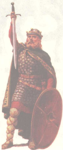
图 2 仍处于军事公社阶段的法兰克社会军事酋长

公元 476 年最后一位罗马皇帝被日耳曼人废除，西罗马帝国终于在蛮族的入侵下灭亡了，在原西罗马帝国的土地上相继建立起许多日耳曼人国家。西欧的封建制度正是在这一背景之下发展起来。