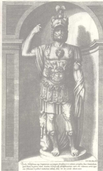
图7 军中权贵骑士阶层充当军队高级官吏，留下显赫功名的不在少数

然而，尽管骑士在希腊、罗马都享有崇高的社会地位，但他们却注定不能成为后世那样凌驾其他一切世俗等级的统治主角，也不可能孕育出