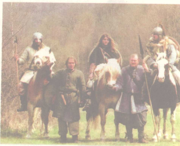
图 11 年轻的日耳曼酋长和他忠诚的亲兵，这种紧密的身份等级日后影响了骑士等级的制定

对封建制度的形成影响巨大的另一因素便是日耳曼传统。它包括亲兵制度和马尔克制度。塔西佗在其书中对亲兵制度记述道：“一个贵族出生的青年，或是一个卓著功绩之人的儿子，在很年轻的时候便可以得到酋长的地位。其他青年们便依附于那些雄武有力、富有战斗经验的人。作为一个酋长的战友并不是一件耻辱的事情。一群战友们又按照酋长的意志分为若干等级……这些青年们平时拥护首领的地位，战时保护他的身体……只有在战争中，他们才能得到荣誉，也只有依靠战争，一个首领