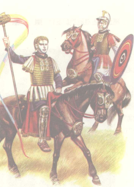
图 10 巅峰时期的罗马帝国东方行省骑士，装备尽管已近完备，但依旧缺乏小小的马镫，终使骑士的作用无法再提高