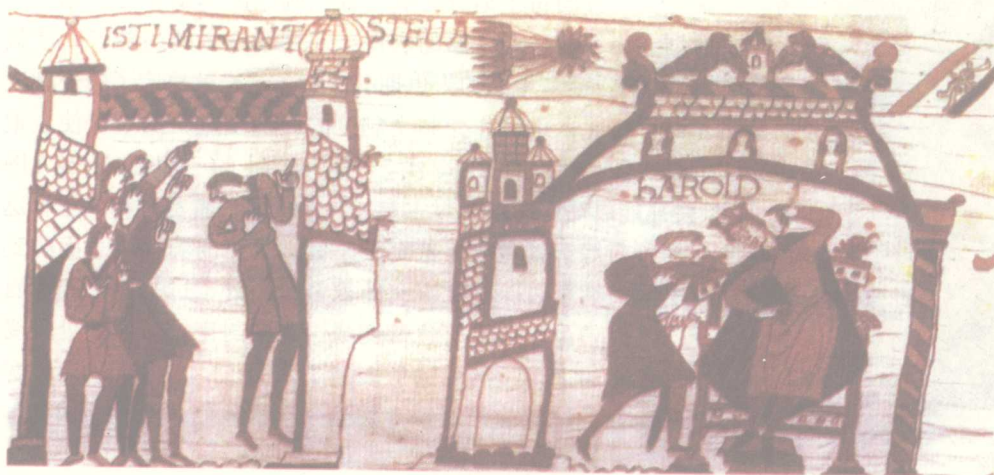
图 3 成为新主人的法兰克人为了使自己更具有道义上的至尊地位，不惜利用星象谶纬，将彗星比喻为改天换地的象征