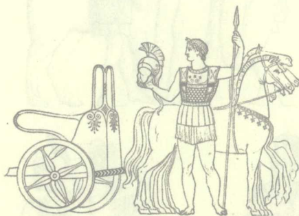
图2 古希腊早期，骑兵的作用反不及战车，战车武士往往也是策马骑士