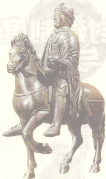
图5 缔造欧洲封建制度的查理曼大帝

采邑制到查理曼时期有了很大发展[图5][图6]。查理曼一生南征北讨，但缺乏足够的资金来维持庞大的军队，故为了巩固骑兵，查理曼进行改革：一方面摒小农于军役之外，让贵族和富裕农民成为职业骑兵；一方面将土地分封成为提供骑士的军事采邑，他将征服的土地划成小块，连同上面的农民一起赐给众多的追随者。这就是采邑制[图7]。拥有地产的人也拥有政权，这样就奠定了骑士制度的坚实基础。因此，采邑作为骑士制度的经济基础，其不仅使土地成为从国王向公、侯、伯、子、男、爵直至骑士的一种层层分封[图8]，而且使凡能以马匹装备为封主参战并接受册封者都可称骑士，这包括参战的所有等级的贵族，甚至国王都以自己的骑士名号而感到荣耀。在这一时期里，除国王旧有的教俗封臣外，过去属于国家官吏的伯爵、马克伯爵和公爵等也都变成国王的封臣，从国王处领受采邑。并且此时的采邑逐渐变为世袭的了。国王的封臣们也可以吸收自己的封臣，并把部分土地作为采邑分赐给他们，从而又成为他