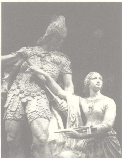
图 12 基督教在欧洲的历史作用是巨大深远的，它在早期的重大意义之一就是阻止了罗马消亡之后欧洲蛮族间大规模无休止的残酷战争，同时推动封建制度迅速在欧洲建立

欧洲自公元 500 年至公元 1500 年的一千年间被称为中世纪，这个时期历来被认为是欧洲最为黑暗的时期。由于蛮族的入侵和定居，引起了罗马帝国的崩溃，几乎造成当时欧洲文化的完全毁灭。西欧的封建制度便是在这一背景下，由日耳曼、罗马和基督教三种因素互相融合〔图 12〕，从罗马灭亡后的废墟上产生、发展起来的。骑士制度同样也产生于中世纪的欧洲，是欧洲在封建化的过程中逐步产生、确立起来的封建附庸制度。中世纪的欧洲国家是一种松懈的领土集合体。在一个国家里，以皇帝、国王、公爵等为最高领主，其他大贵族则以向其宣誓效忠来换取封地——“采邑”，从而成为最高领主的附庸。这些附庸各自又可以拥有从属于自己的附庸，往下排列直到拥有少量土地或无地的骑士们。如此便构成了西欧完整的封建等级体系。