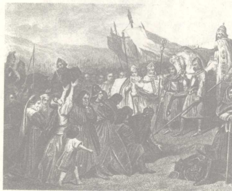
图 1 法兰克人进入高卢地区

法兰克人进入高卢地区后 [图 1] [图 2]，没收了罗马皇室和部分奴隶主的土地，并有很多土地被墨洛温王朝的国王和他的亲兵们所占有 [图 3]，他们成了新兴的封建地主阶级。因为法兰克自由农民越来越少，兵源受到威胁，同时骑兵战术日益成为主导战争的主流 [图 4]，新的兵源和兵役制度处于迫切酝酿中。8 世纪时，一匹带装备的马相当于 45 头母牛或者 15 匹驮马的