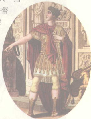
图9 罗马时期高级宫廷骑士的典型形象，奢华、威武又不失优雅风度