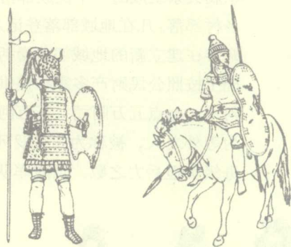
图1 距今3000年前希腊迈西尼文明时期就有了骑马的武士，几乎与世界最早的骑兵同期

罗马采用与希腊同样的公民兵制度。罗马奴隶制国家的形成是通过发生于约公元前6世纪的塞维·图里乌斯改革实现的。塞维为了适应当时社会发展，加强罗马实力，首先废除原来按