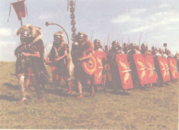
图4 罗马军队的基本编制单位：百人队