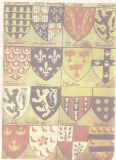
图9 封建领主登记在册的属下骑士家族纹章花名册

然而中世纪的国家是一个松弛的封土集合体，并没有明确的国界概念。它的财产权和主权到处相互转化，欧洲的封建制度是一种政治、经济合一的制度。封建领主在其封土内首先明确拥有的是土地的所有权，进而在王权衰落后，又逐步取得了王权在地方的权力，并将其转化为同封土一并世袭的私人权力，其中包括行政、司法、税收、铸币等权力。追究欧洲封建制度的产生根源，