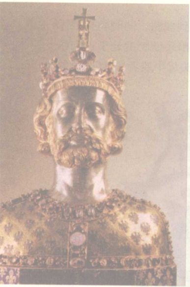
图6 被教会奉为圣物的查理曼遗骨匣上的金像

价值，到9世纪仅一匹马就等于6头牛的价值。761年，一个叫做伊散哈德的人，只为一匹马一把剑，就不得不卖掉他祖传的土地，并卖掉了一个奴隶。而实际上，一个骑士在战争中作战，一匹马是不够的，他需要三到四匹轮换的马，每匹马会吃掉大量的粮食，尤其在农业生产不发达的当时，是种极大的花费。另外盔甲都要去铁匠铺量身定做，此外还有扈从的装备……毫无疑问，最早的骑兵和骑士都必须且只是贵族和有钱人，因为只有他们才有能力购置昂贵的装备。义务兵制已不能再为封建主提供足够的军力，于是墨洛温朝开始实施“采邑制”。将土地作为采邑分封给贵族和教会，采邑领受者必须为赐予者服兵役，并向其宣誓效忠；采邑的赐予者有义务保护领受者，使其不受他人的伤害。这恐怕就是中世纪骑士制度的开端。