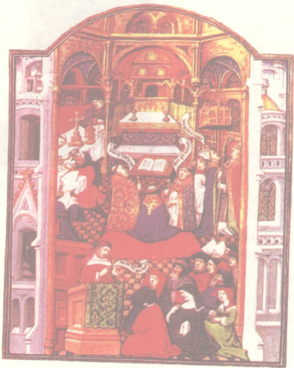
图 12 基督教极为成功地在 中世纪欧洲建立起庞大的精神帝国

才能维持一群战士，因为战士们希望从首领的手中得到战马和武器……”亲兵制度在法兰克国家中逐步同采邑与封土结合起来，形成新型的封建附庸群体——骑士[图 11]。