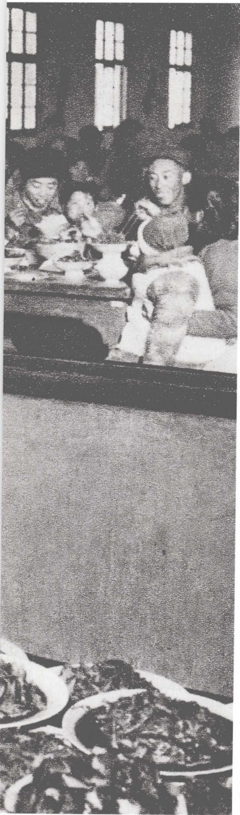
公社食堂 1959年

“公社食堂”是专属于“大跃进”时期的词汇，“吃饭不要钱”曾经是人们向往的共产主义社会模式的美好前景之一。