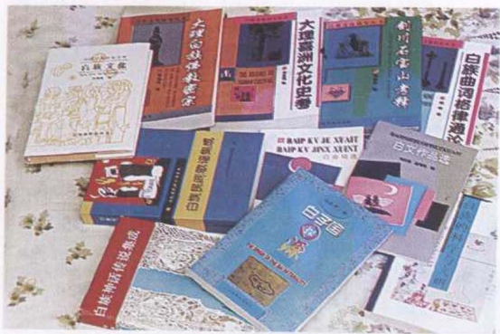
部份白族文化图书