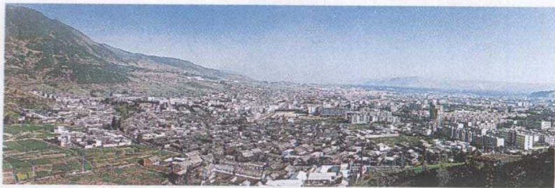
大理白族自治州首府——大理市