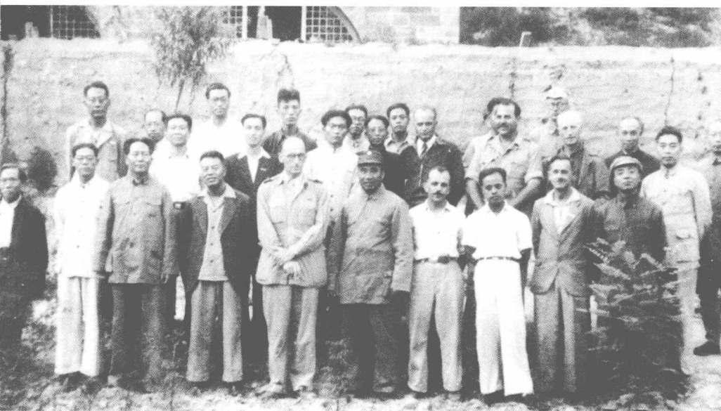
1944年6月12日毛泽东在延安接见中外记者西北参观团，图为接见时合影。后排右三为吴玉章。