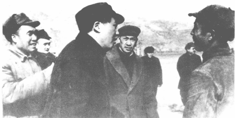
吴玉章、毛泽东、朱德、任弼时等在延安机场。