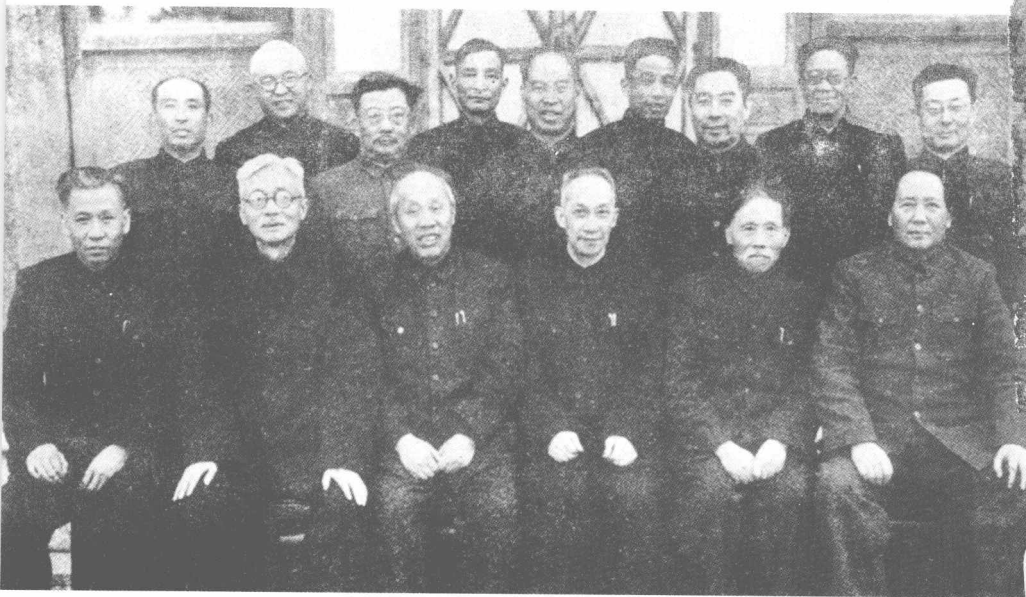
参加人民政协的中共代表合影。前排右起第三人为吴玉章同志。