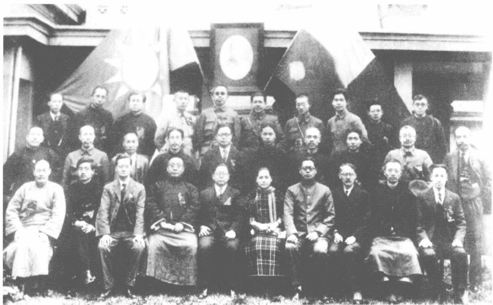
1927年3月吴玉章在国民党二届三中全会上当选为中央常委和中央政治委员。前排右起第一人为吴玉章。中排右起第二人为林伯渠,第三人为毛泽东。左起第二人为董必武。