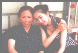
迄今为止我最满意的一张母女合照