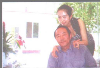
父亲永远都是我最坚实的依靠