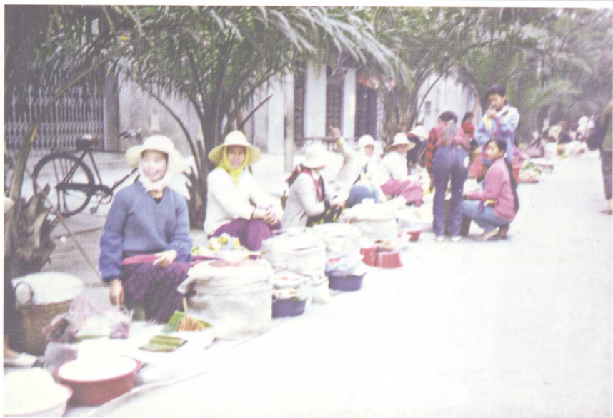
星期日人们在县城大街上互市赶街。