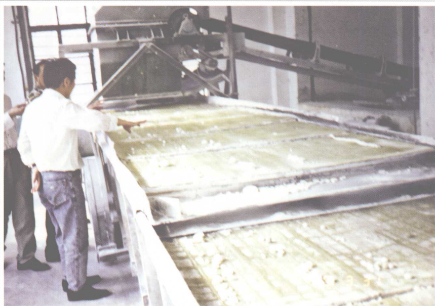
勐滨糖厂是全县目前最大的糖厂，这是出糖车间。