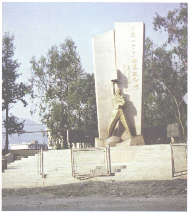
右图为澜沧“11·6”地震纪念碑。该碑反映了全县人民克服困难，重建家园的英雄气概。