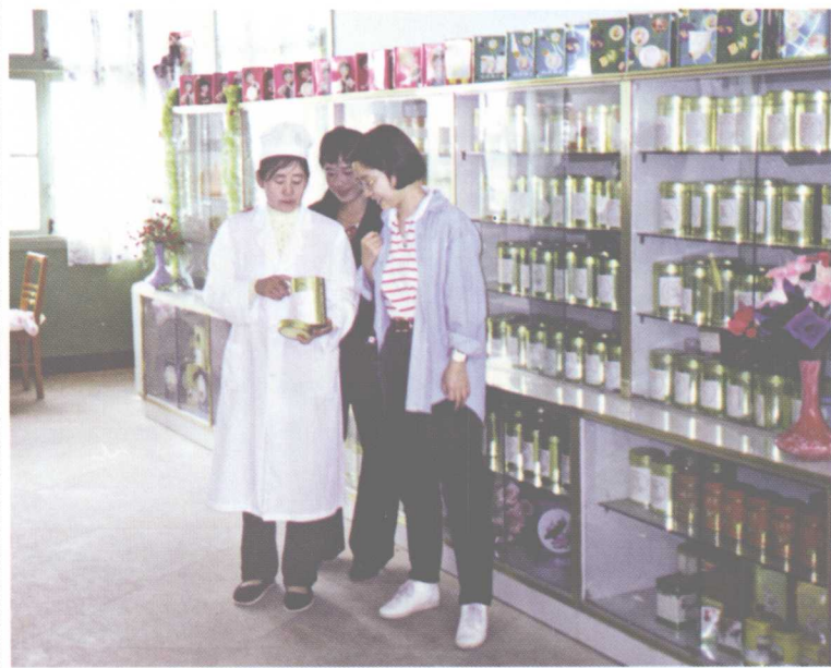
澜沧县茶厂的产品陈列室。