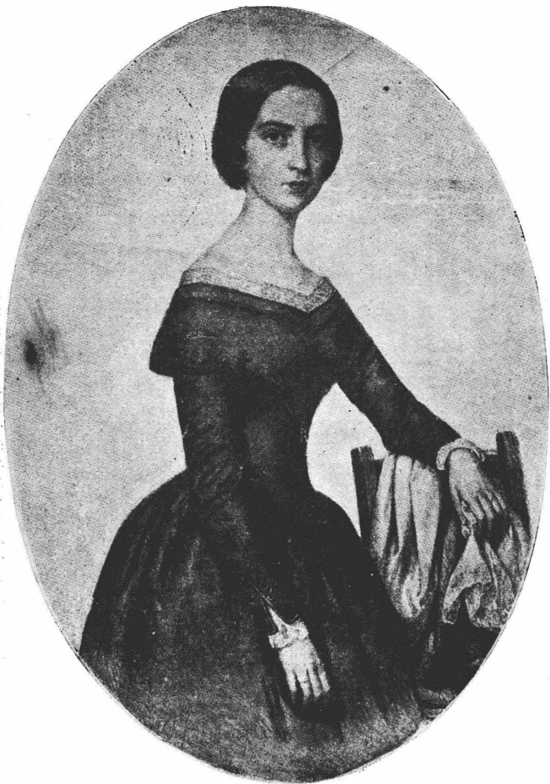
裴多菲夫人森德莱。尤丽亚 巴拉巴士·米克洛什作