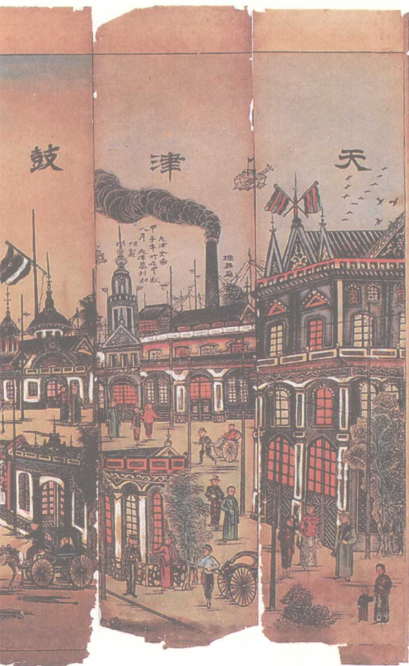
■ 石印年画《天津鼓楼真景全图》