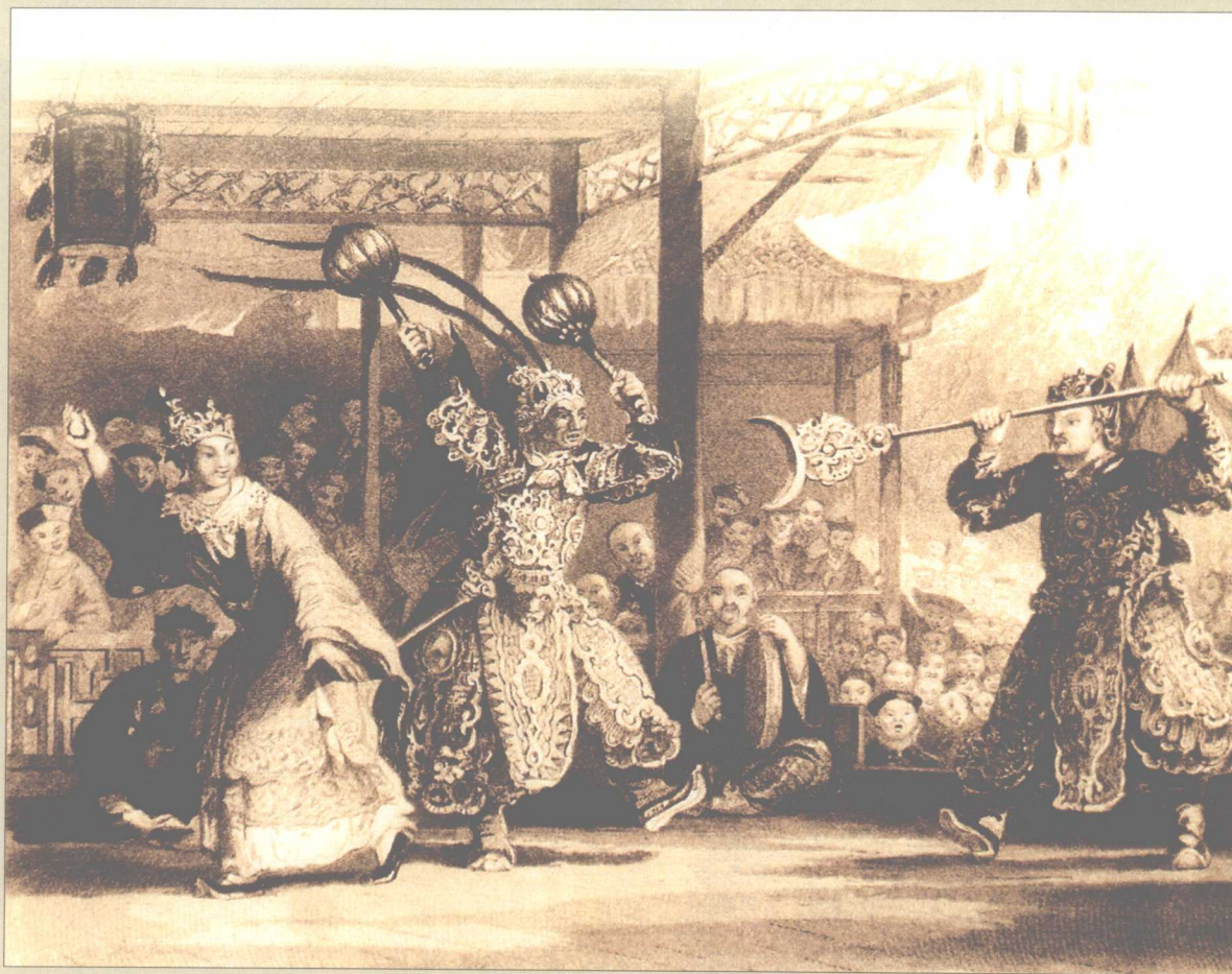
■ 外国画家所绘的《大戏台子》。