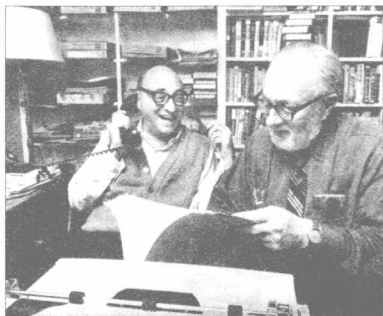
巴纳比·罗斯 Barnaby Ross ——埃勒里·奎因的面具

埃勒里·奎因的“悲剧系列”是全世界水平最高的系列推理小说之一。这四幕“悲剧”的精彩不仅仅限于故事本身，台前幕后的花絮时至今日依然是读者津津乐道的话题。