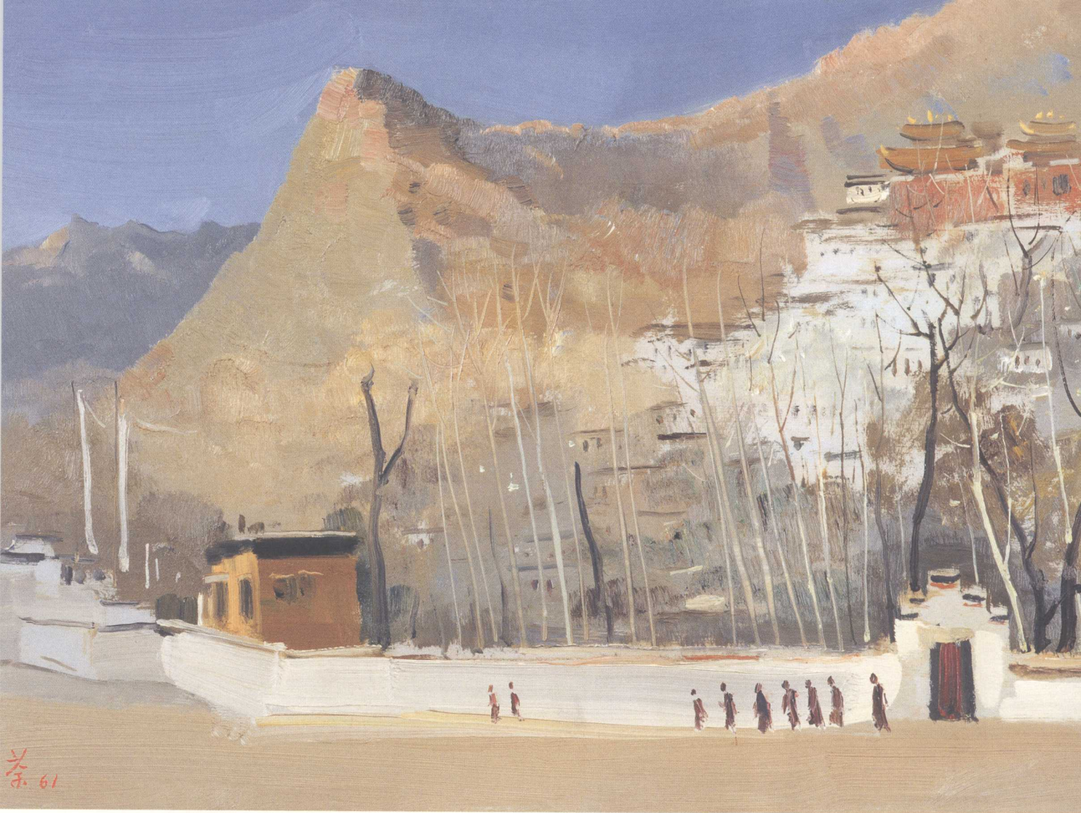
扎什伦布寺（油画） 1961年