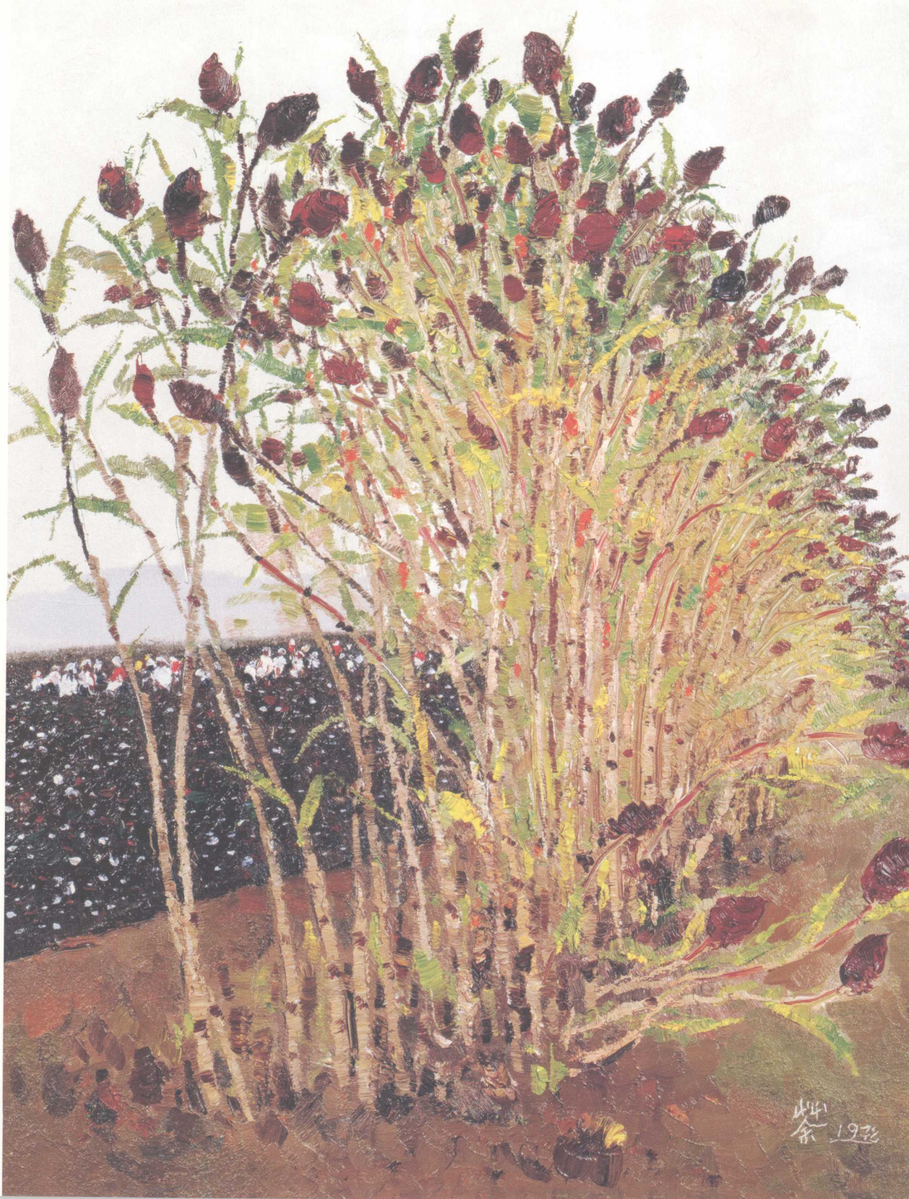
高粱与棉花 (油画) 1972年