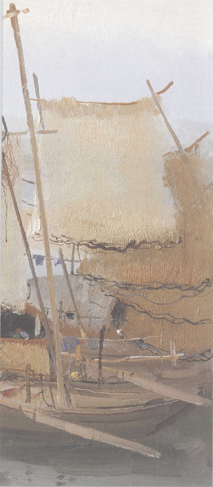
富春江上打渔船（油画） 1963年