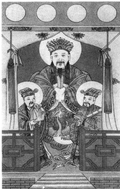
三官（采自《中国道教诸神》）

弘景（456～536年）继续吸收儒、释两家思想，充实道教的内容；构造道教神仙谱系，叙述道教传授历史，主张三教合流，对以后道教的发展影响甚大。道教经过南北朝的改造之后，其教理教义、斋戒仪范等都大大地得以充实和健全，使它逐步成熟起来，改变了早期比较原始的状态，并由民间的宗教转化为上层化的为封建统治服务的士族贵族的宗教。