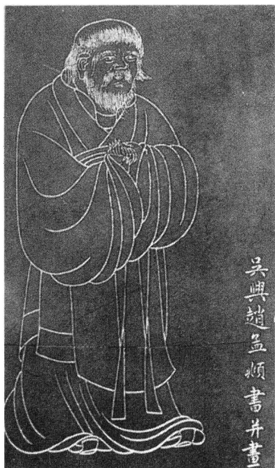
宋赵孟頫画老子画像

道家学派在中国哲学史上，第一次把“道”当作世界的本原，并提出了一个以“道”为中心的宇宙本体论哲学。这是道家哲学最主要的思想。关于“道”，老子作过多种解释，后人也从不同角度对它有多种概括，如1934年，许地山就指出：“道可以从两方面看，一是宇宙生成底解