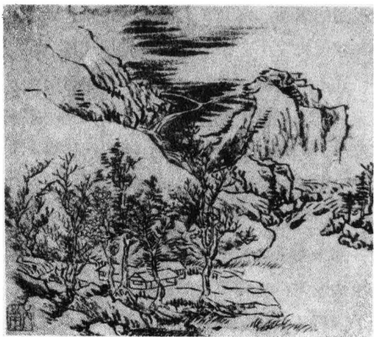
十三岁时勾摹明人稿本(十三岁时原名丙南号阿梦)

画史，才把它打破。我既然爱画中的山，我就天天向古人的画本临摹，东借西借不知借过了多少画本，但是我在这时既无鉴别真假能力，又无辨别好坏的识力，只要看见有比我画得好的画，我就向它学习。