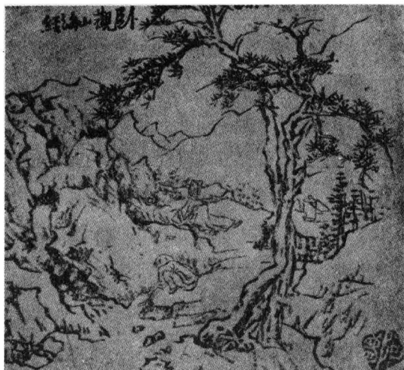
十三岁时(1903年)勾摹明人稿本(阿梦是我十余岁时的别号)