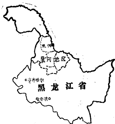
图 1 黑河地区在黑龙江省所处位置示意图