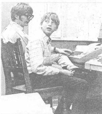
1969 年，盖茨与同学保罗·艾伦在小学的电子室里，他们后来共同创立了微软。

西雅图湖滨中学是美国最早开设电脑课程的中学。学校的一台终端机连接其他单位所拥有的小型电子计算机 PDP-10，每天只能使用很短时间，每小时的费用也很高。盖茨像发现了新大陆一样，只要一有时间，便钻进计算机房去操作那台终端机，几乎到了废寝忘食的地步。因为那台简陋的终端，比尔·盖茨与保罗·艾伦在学校机房里结识并成为好朋友。很多年以后，他们成为这个星球上最富有的少数几个人之一。