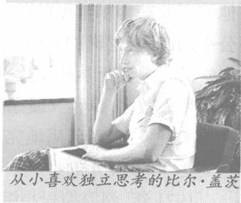
从小喜欢独立思考的比尔·盖茨

比尔·盖茨和保罗·艾伦两人经常在学校的电脑上玩三连棋的游戏。通过纸带打字机玩游戏,也能编一些小软件,诸如排座位之类的软件,比尔·盖茨玩起来得心应手,只要略施小计就可以使他的周围聚满羡慕不已的女生。13岁的盖茨独立编