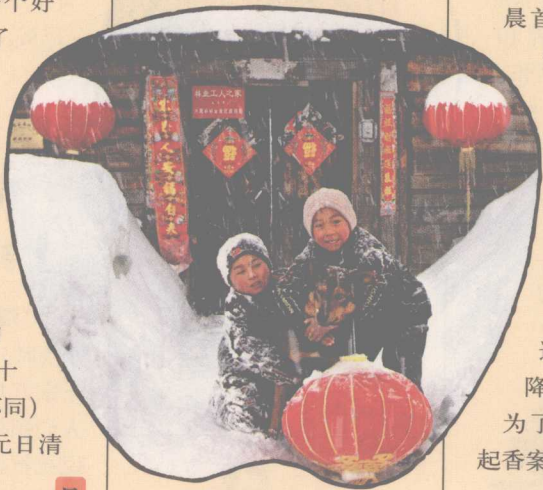
雪乡春节期间在雪中玩耍的孩子

人们在响彻云霄的鞭炮声中迎来新年，俗信伴随着新的时间降临的是各色神灵，旧年上天汇报的诸神，这时又带着新的使命降临人间。正月初五为了迎接财神，各家摆起香案，虔诚祭祀。