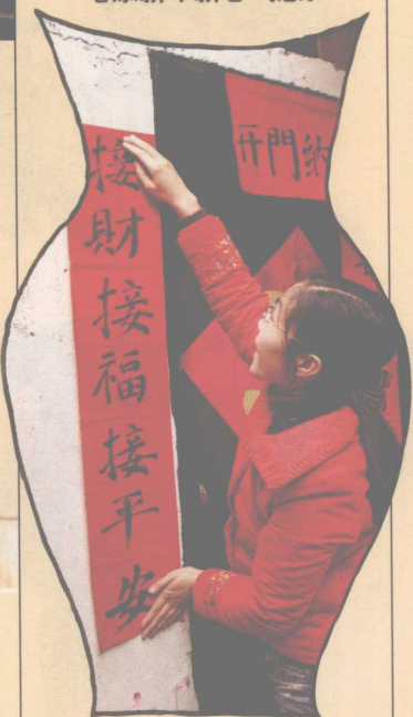
过年家家门上都贴上红红的对联