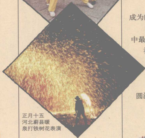
正月十五 河北蔚县暖 泉打铁树花表演