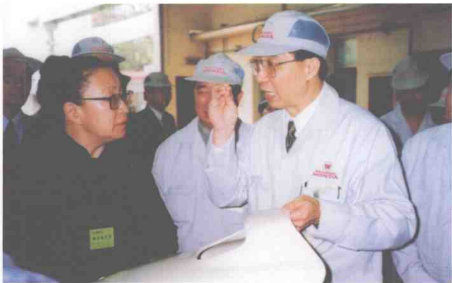
图为毛泽东的女儿李讷和部分元帅、将军的亲属在公司参观访问