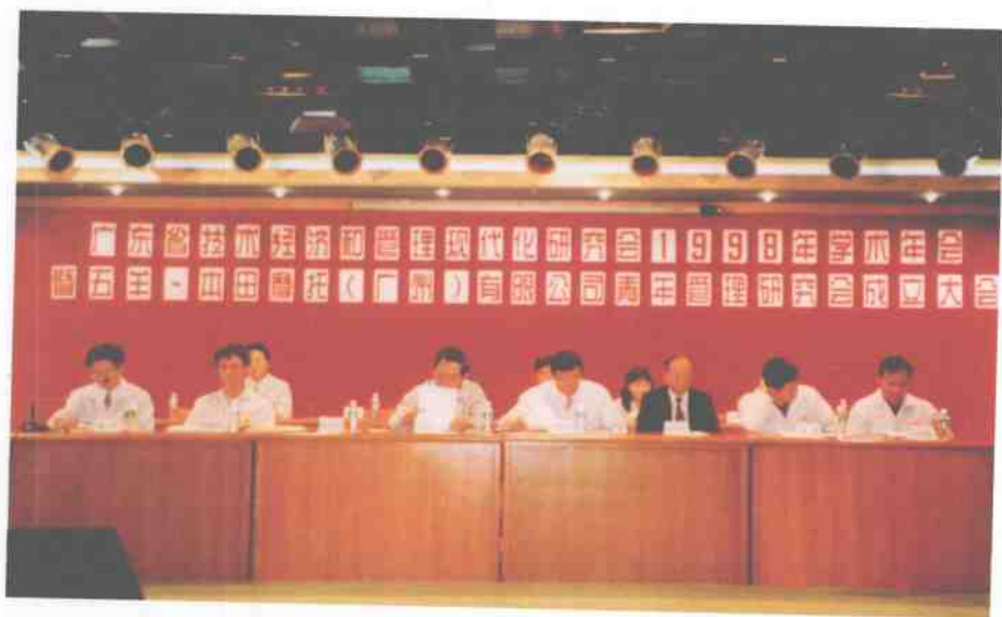
公司非常重视群众团体工作,努力营造有利于员工参与管理和进行思想交流的无边界管理体制,调动一切积极因素,促进公司生产经营的发展。图为公司青年员工自发组织成立的青年管理研究会成立大会