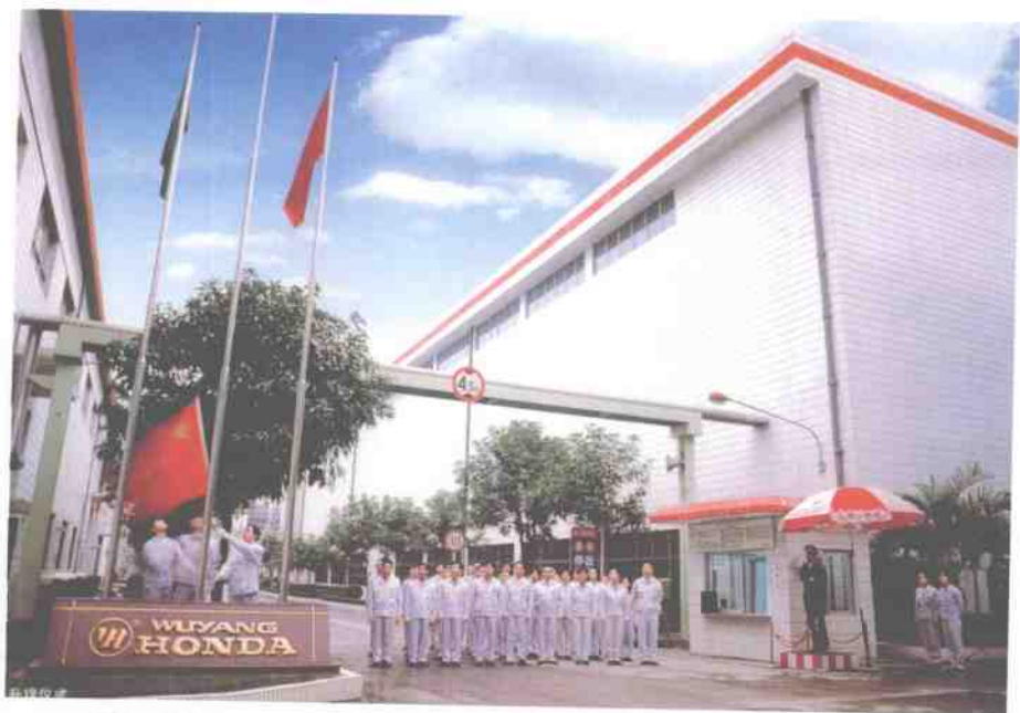
公司每周都组织员工举行升国旗仪式,以此培养员工爱祖国、爱企业的精神