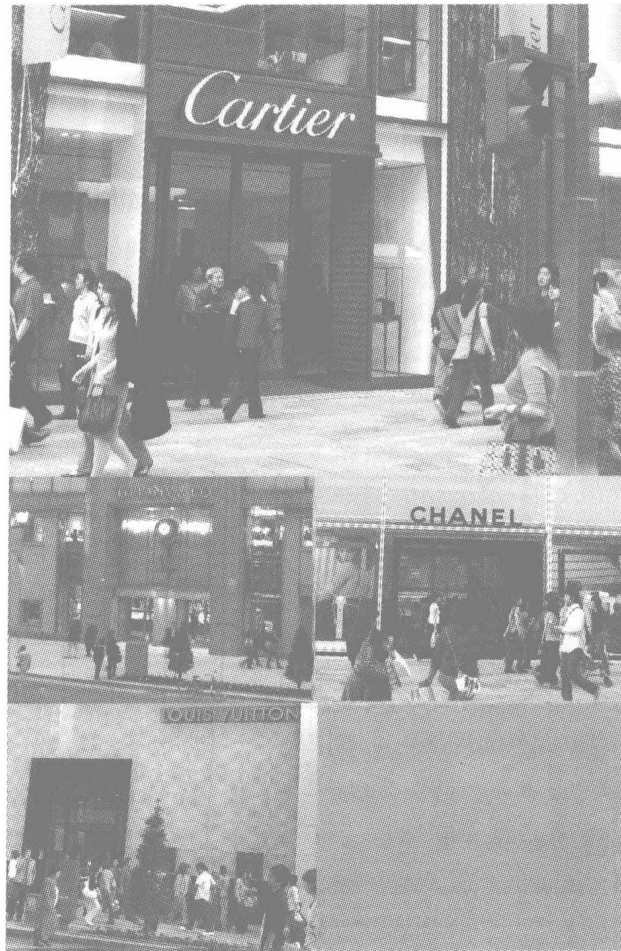
有着卡地亚、蒂芙尼、香奈尔、路易·威登等名品的银座大街。

银座珠宝行迪亚蒙店是在全国拥有 240 家连锁店的宝石生产销售公司——三贵的商店。三贵是以“只追求第一”的理念，1991 年针对顶级顾