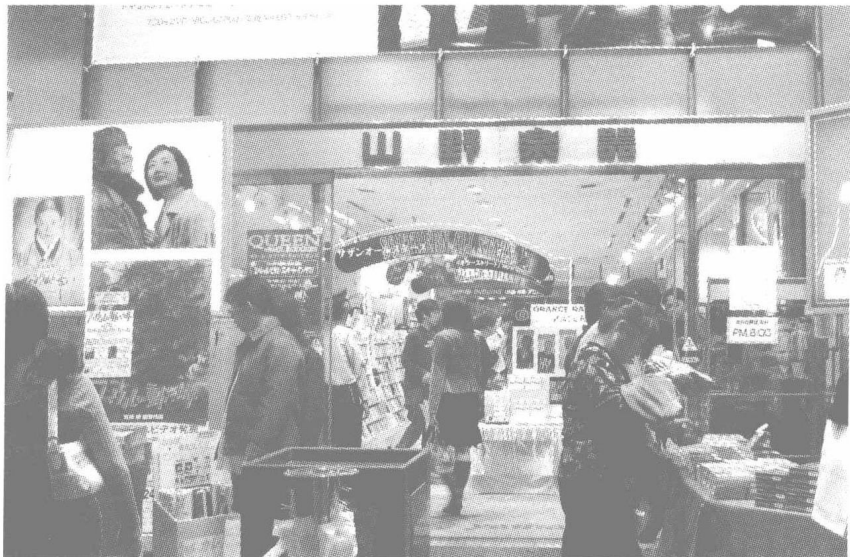
韩流热潮汹涌的银座。《大长今》和《冬日恋歌》的海报映入眼帘。

星巴克现象说明,银座除了影响经济领域之外,对于日本国内的文化也产生了不容忽视的影响。