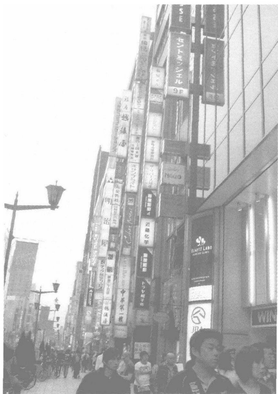
从银座第一街区到第八街区,超过百年历史的商铺就有 147 个。

之所以做好消防队的工作是因为他坚信“大地震以 60 年为周期发生”。东京关东大地震是 1923 年发生的,因此他认为 60 年之后的 1983 年