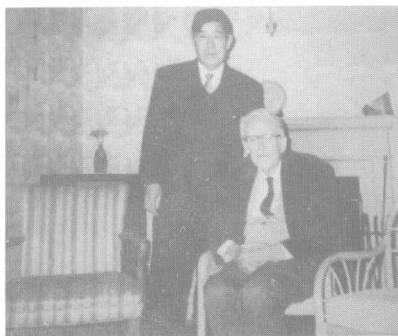
本书作者与帕塞尔教授合影(1993年)