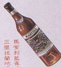
馬爹利基酒 三星拔蘭地酒