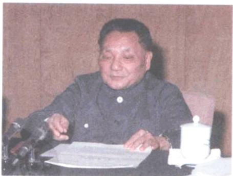
1978年，在党的十一届三中全会上，邓小平就《解放思想，实事求是，团结一致向前看》讲话

1976年，十年“文化大革命”宣告结束，尤其是1978年12月党的十一届三中全会的召开，摈弃了长期以来奉行的“以阶级斗争为纲”的路线，使党的工作重心真正转移到社会主义现代化建设上来，这是新中国成立以来具有深远意义的伟大转折。广西壮族自治区的各项建设事业也从此进入了一个飞速发展的新时期。