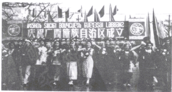
广西各族人民欢庆自治区成立的盛况

1956年10月，中共中央提出了建立广西壮族自治区的倡议，得到了广西人民的热烈拥护。1957年6月，国务院做出建