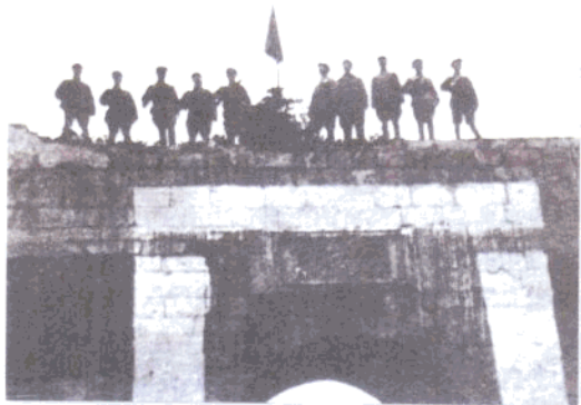
五星红旗插上镇南关

寨——镇南关（今友谊关）。至此，广西全境宣告解放，“八桂大地”的历史从此翻开了新的一页。