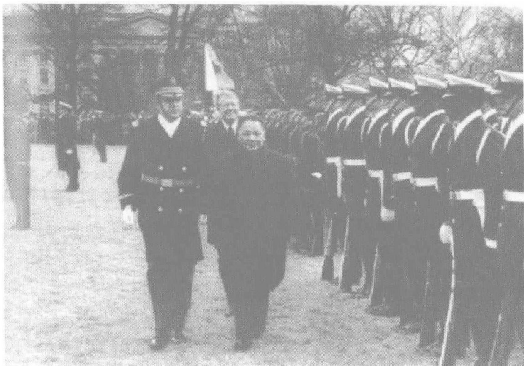
1979年，邓小平副总理在卡特总统陪同下检阅仪仗队