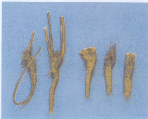
左:北柴胡 右:南柴胡

〔来源〕伞形科植物柴胡、狭叶柴胡的干燥根。〔性味归经〕苦,微寒。归肝、胆经。〔功能主治〕和解表里,疏肝,升阳。用于感冒发热,寒热往来,胸胁胀痛,月经不调,子宫脱垂,脱肛。〔鉴别特征〕本品根头有茎基,下部有分枝,表面黑褐色或红褐色。气微香。其中根头膨大、茎基多、无毛须,下部分枝多,表面黑褐色者为北柴胡;茎基少,有毛须,下部分枝少,表面红褐色者为南柴胡。〔附注〕因植物来源及性状不同,药材商品上称前者为北柴胡,后者为南柴胡。