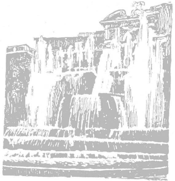
图 1-3 埃斯特庄园喷泉