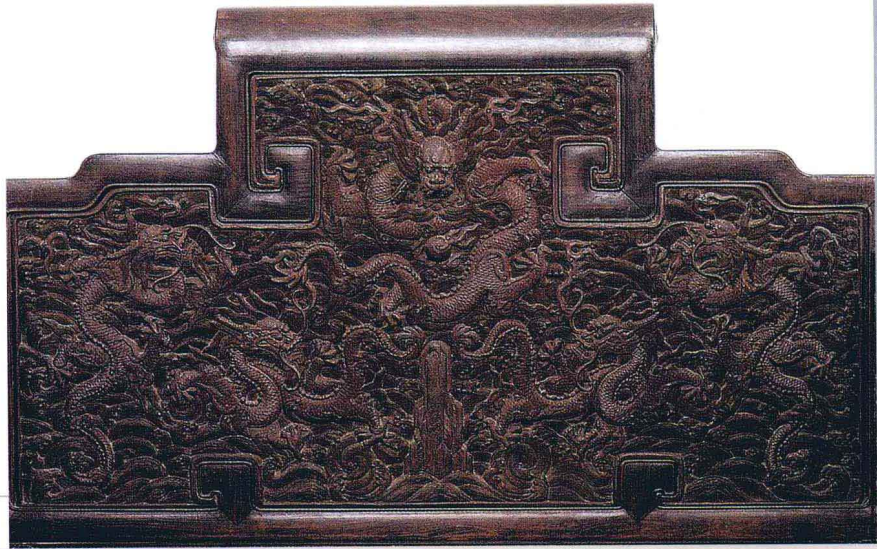
紫檀雕漆云龙纹(清) 北京故宫博物院藏

逸的金鱼尾巴。因此我们可以说龙是集中了天空中的飞禽、水中的鱼类、地上的走兽中最精华的部分，配置得体而和谐。龙常常和变幻莫测的云、水和火相伴，每当它翻卷腾飞之际，四条腿上披绕着的火焰便会窜动飞舞起来，它使灵动着的游龙更增添了炽烈、神奇的气氛。