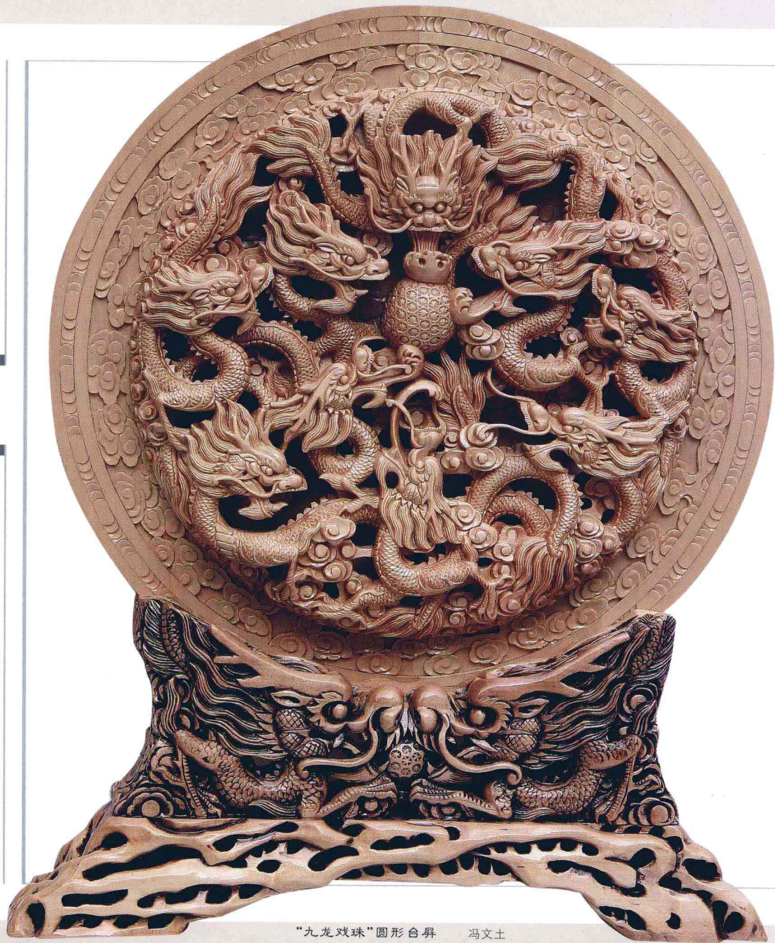
“九龙戏珠”圆形台屏 冯文士