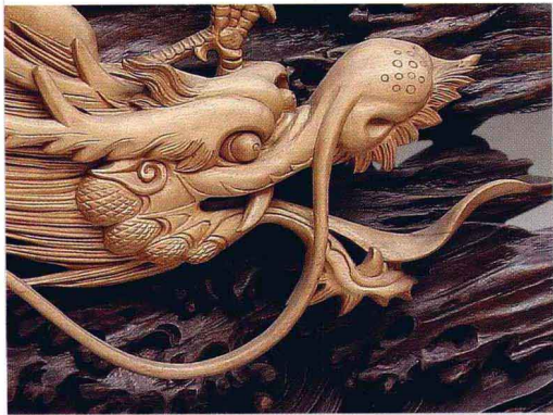
龙头造型之二 冯文士

明清时期的龙纹是历代龙纹演变的最后一个阶段，也是龙发展最完美的一个阶段。从龙的头部来看，它是由狮的鼻、虎的嘴、牛的耳、金鱼的眼、鹿的角和马的鬃所组成，再加上英武的剑眉、飘动的长髯，显得神奇而又威猛。而龙的躯体则是由蛇的躯体添加上鲤的鳞甲和脊椎所组成；龙的四肢以虎的腿，加上带肘毛的鹰爪所组成；尾部则是灵活飘