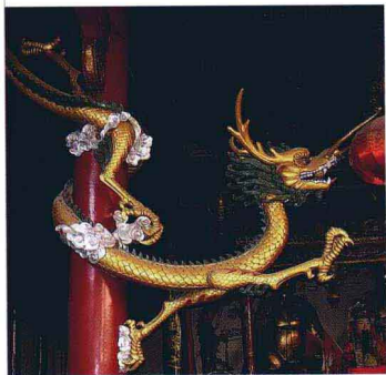
盘柱蟠龙 浙江嵊州寺院

逸的金鱼尾巴。因此我们可以说龙是集中了天空中的飞禽、水中的鱼类、地上的走兽中最精华的部分，配置得体而和谐。龙常常和变幻莫测的云、水和火相伴，每当它翻卷腾飞之际，四条腿上披绕着的火焰便会窜动飞舞起来，它使灵动着的游龙更增添了炽烈、神奇的气氛。