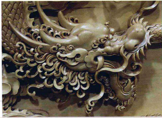
龙头造型之三 佚名