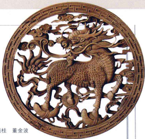
“踏宝托月”圆盘 魏顺柱 董金波