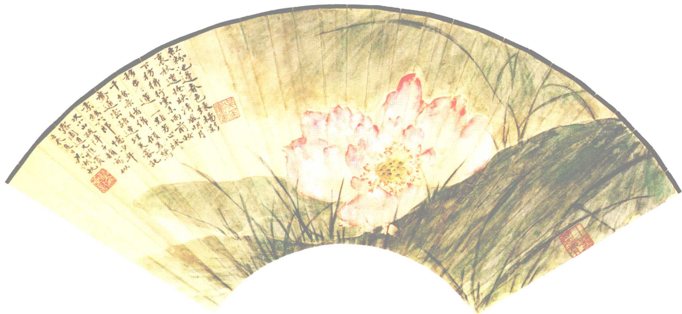
红粉池边春色 (扇面)