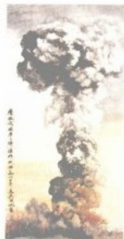
庆祝我国原子弹爆炸成功