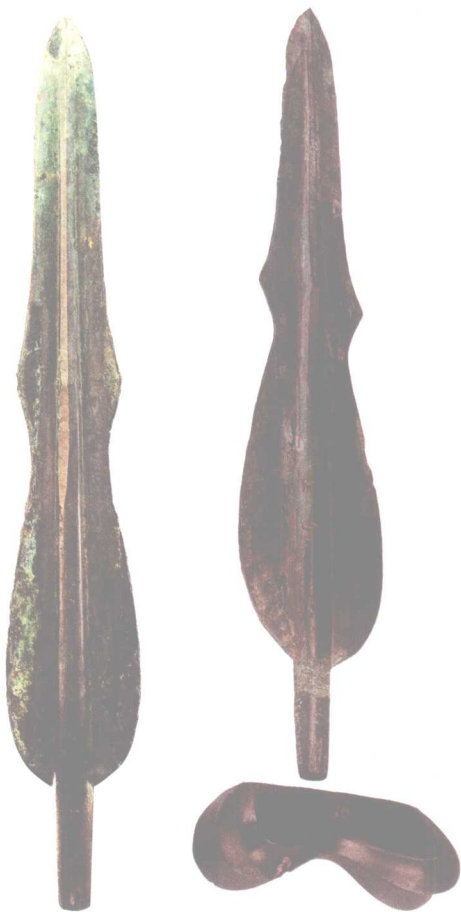
● 二者皆为曲刃短剑，左为十二台营子铜剑，右为青铜短剑

历史黎明时期的辽宁，在中华统一多民族国家的形成和发展过程中，在中原与东北以至东北亚地区诸民族文化的关系中，都曾起到过特殊重要的作用。