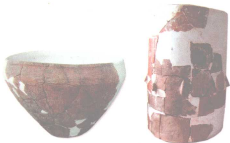
● 红山文化时期的陶罐

距今五千年前，活动在辽西山区的红山文化人，在与黄河流域仰韶文化的频繁交流过程中，率先跨进了文明的门槛。在牛河梁遗址发